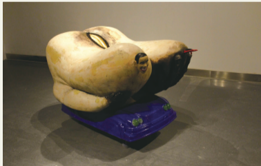
《一元玩一次》童昆鸟