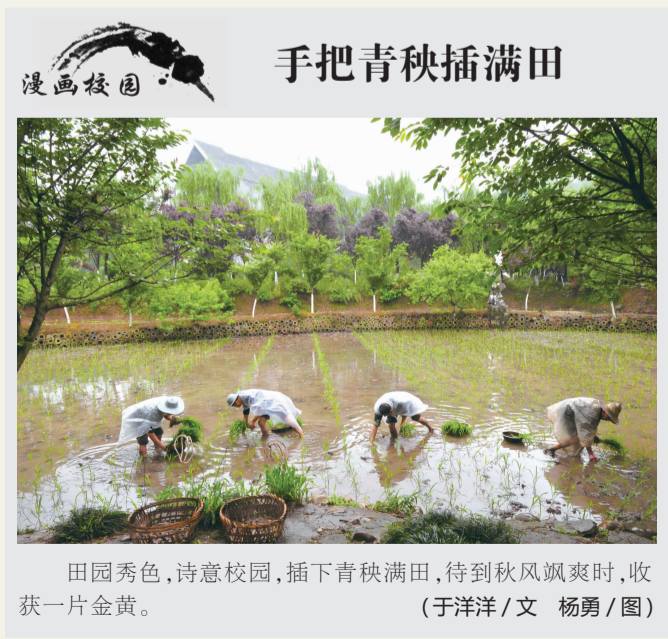
漫画校园 手把青秧插满田 田园秀色,诗意校园,插上青秧满田,待到秋风飒爽时,收获一片金黄。 (于洋洋/文 杨勇/图)

过程中会有许多事情是你无法接受的,但还是要相信,保持一颗良好的心态,才能不那么容易被苦难压倒。