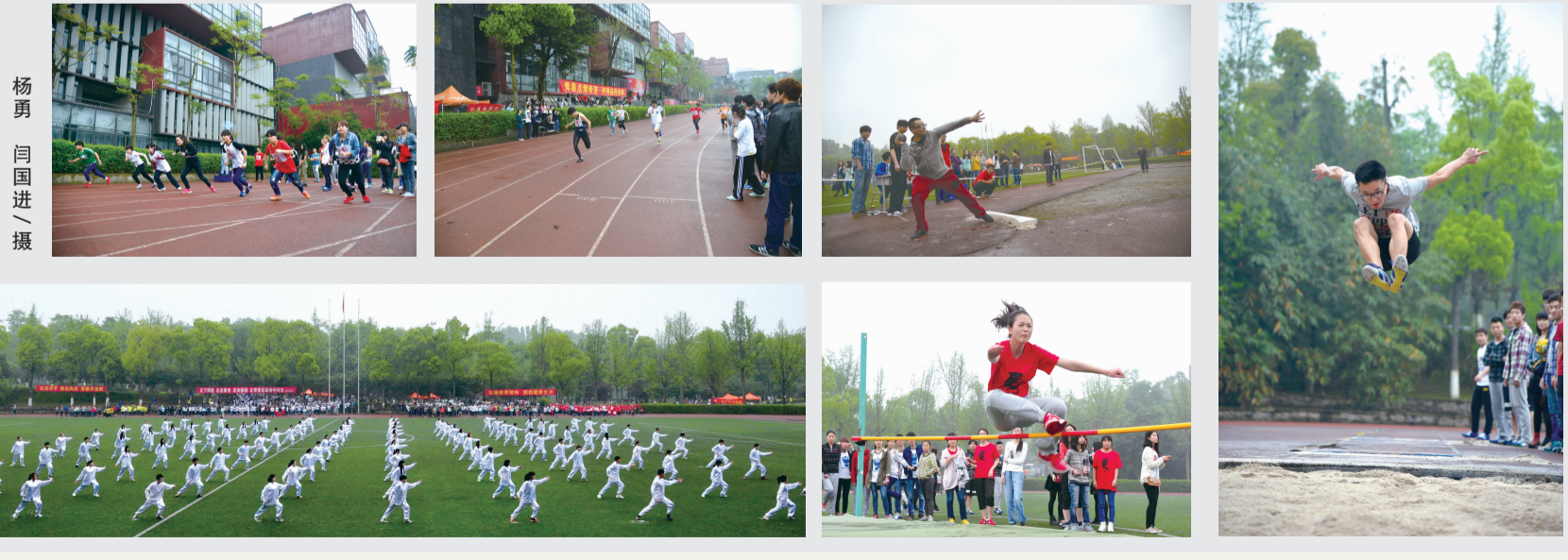
校对:李苗利 杨勇 周俊