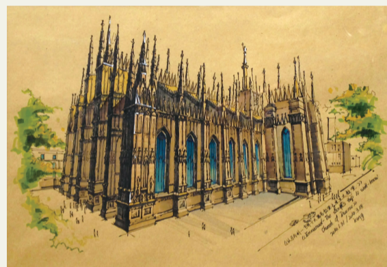
刘金鑫《以马内利——米兰大教堂》