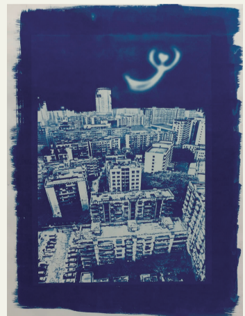
单韬光《那个夏天的夜晚 small》