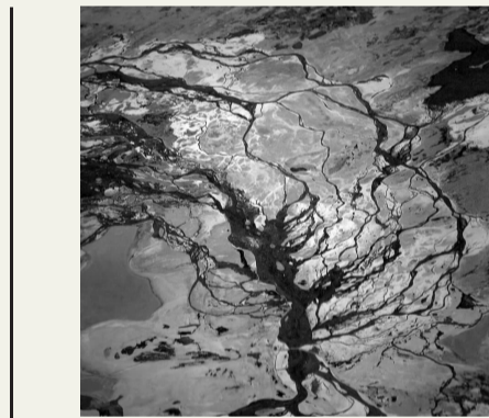
吴时敏《雅鲁藏布江水系,西藏》