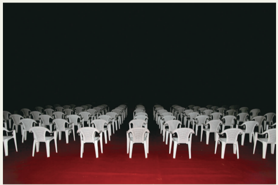
曾途《chairs is not everything 015》