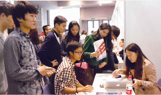
本报讯 10月24日,由我校学生处、成都高新技术产业开发区管委会联合主办的天府软件园专场双选会在我校举办。来自天府软件园的50余家企业、校内外外的2000多名毕业生参加了双选会。(杨寒/文)