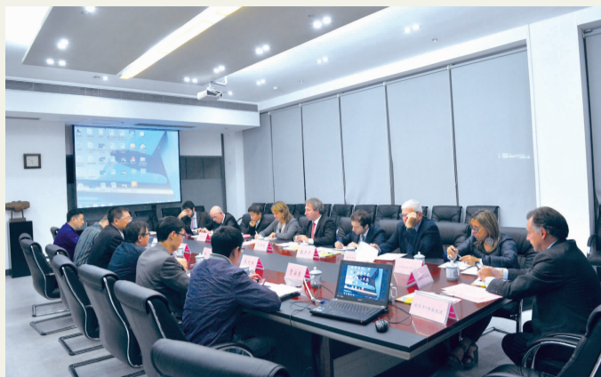
本报讯 10月28日下午,意大利翁布里亚大区政府代表团一行13人到我校访问。代表团以大区副主席卡拉·

卡西亚里女士为团长,意大利驻重庆总领事馆总领事马非同,翁布里亚大区企业、工作、培训国际化厅厅长,翁布里亚大区国际合作关系服务局局长及大区教育部门负责人,佩鲁贾外国人大学负责国际交流的主管等高级官员和高校相关部门负责人随行来访。我校党委书记黄政热情接待代表团一行,对代表团来校访问交流表示欢迎。双方就教师、学生、学术互换等方面的合作展开交流。