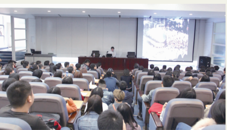
本报讯 10月29日下午,应公共艺术学院邀请,中央美术学院雕塑系教授秦璞在黄桷坪校区学术报告厅作了题为“公共艺术之路”的讲座。讲座围绕

“公共艺术是什么”、“公共艺术的核心价值”、“公共艺术与社会的关系”、“公共艺术从哪里来到哪里去”等问题展开。(公共艺术学院/文图)