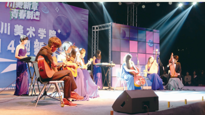
本报讯 10月29日晚,我校在虎溪校区断桥广场举办名为“川美新章 青春制造”的晚会,欢迎2014级新同学。学校党委书记黄政、党委副书记左益出席了晚会。晚会紧密围绕社会主义核心价值观和“川美新章 青春制造”的主题,展现出我校大学生积极、健康、向上的精神风貌,节目类型涵盖了演唱、舞蹈、乐器、表演等多种形式。