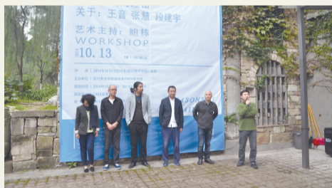
本报讯 10月12日至14日,《作为绘画的理由——关于王音、张慧、段建宇》艺术工作坊项目在油画系CAEA美术馆进行。作为2014年度油画系“当代艺术名家进课堂系列项目”的重头戏,整个活动由小型艺术实践展、工作室交流、学术讲座、专题研讨几个环节组成,著名青年批评家鲍栋担任了活动的艺术主持。