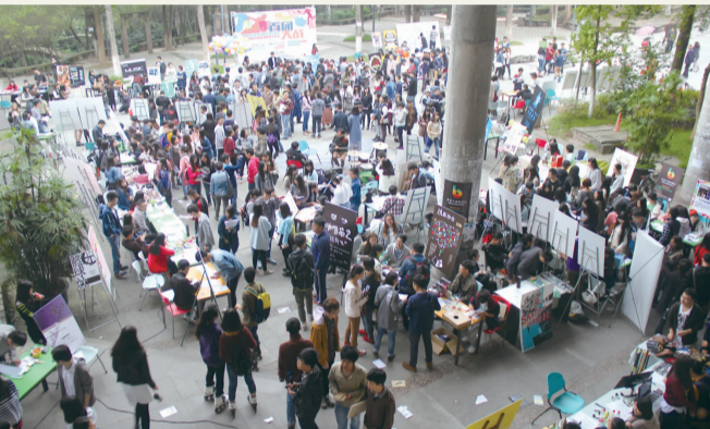
本报讯 10月15日,校园文明巡逻队成立暨2014年社团招新活动开幕式在食堂小广场举行。党委副书记左益出席了仪式。学生代表向全校同学发出“文明校园,由我做起”的倡议。(吴倩/文)