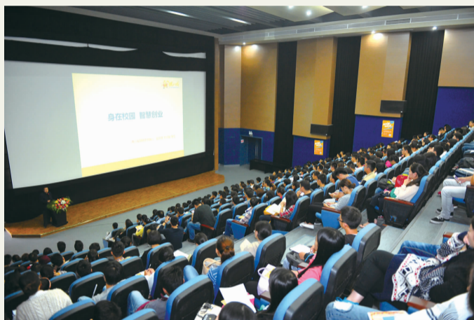
本报讯 10月27日下午,重庆市创新创业创优系列宣讲活动“身在校园 智慧创业”在我校虎溪校区小剧场举行。团市委副书记叶力娜,我校