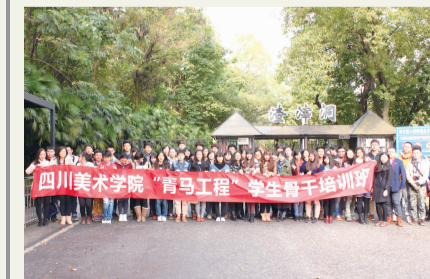
大学生骨干参加“青马工程”培训