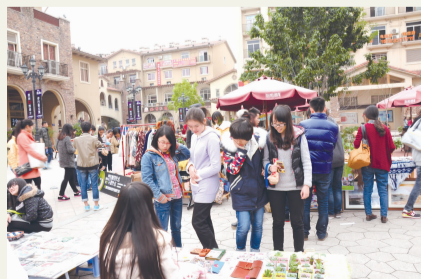
川美创意市集走进大学城熙街