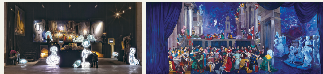
张钊瀛 《泰坦之堡》综合