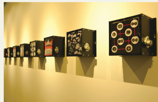
蔡远河 《错位与异化》机械运动装置