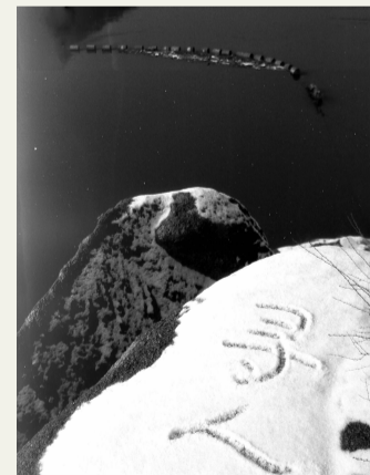
董路路 周文华 《寻人》影像装置