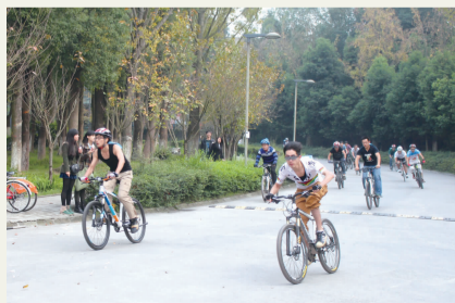
首届“骑行川美”自行车大赛举行