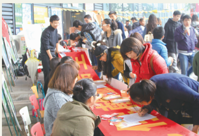
志愿者积极参加无偿献血活动