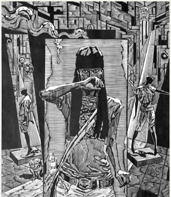
李仲 《都市·行走 NO.7》