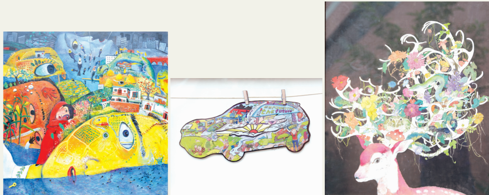
第一名 消逝 张燕 第二名 Gift 冯知之 第三名 渡 杨顺谦

本报讯 11月8日上午,我校举行“艺术学与水墨高等研究中心”授牌仪式和“重庆市两江学者计划特聘教授团队”授聘仪式,并开展了“水墨史:21世纪的思想与方式”的学术交流