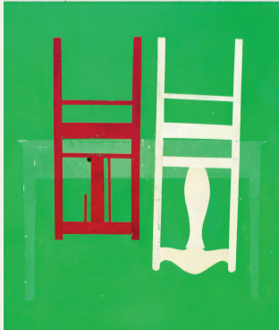
冷广敏《正面风景》油画