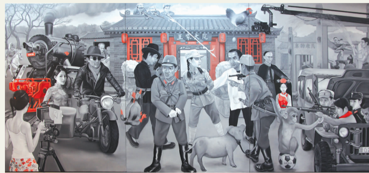
《烽烟往事》 陈一墨 指导教师：庞茂琨