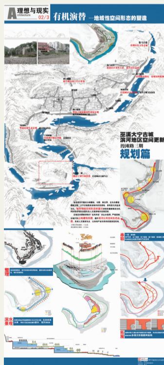
《有机演替——新地域性空间形态的塑造》 陈中杰 指导教师：黄耘