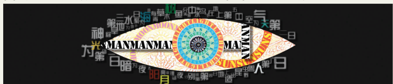
《eye》 李琛 指导教师：周小波