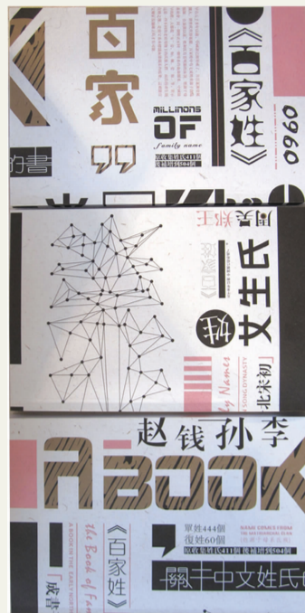
《百家姓》书籍装帧 丁楠 指导教师：罗力

中共四川美术学院委员会主管主办 | 主编 左益 | 副主编 钟正武 | 国内统一连续出版物号：CN50-0815/G | 投稿邮箱：yuanbao@scafi.edu.cn