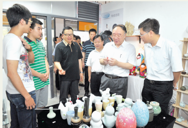
黄奇帆市长一行参观微企创意产品。

本报讯 7月2日上午，重庆市政府市长黄奇帆在沙坪坝区委书记李剑铭等领导陪同下视察指导我校大学生微企园工作。学校党委书记黄政，校长罗中立，副书记左益，副校长郝大鹏、侯宝川、庞茂琨等陪同参观。黄奇帆视察了入驻我校南门的重庆市大学城文化创意微型企业园的微型企业，并与创业的同学亲切交流。黄政代表学校党委、行政，向黄奇帆汇报了创业园的建设情况和开展大学生自主创业工作的相关情况。创业园是面向全市大学生设立的市级文化创意产业类微型