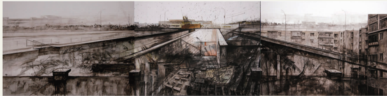
《邂逅黄桷坪——后街入口》 孙丹丹 指导教师：刘晨曦