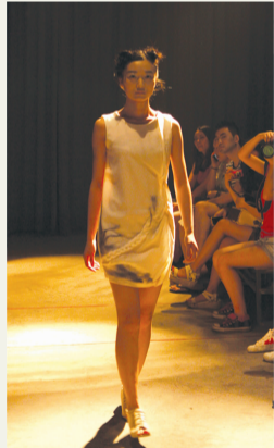
《lonely person》 张缈 指导教师：苏永刚