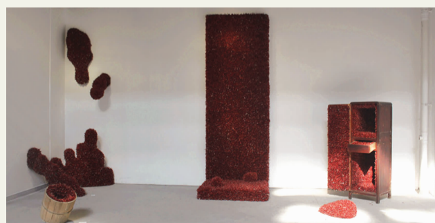
《衍》 华丽丽 指导教师：中晓南