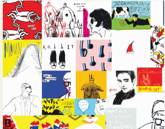
《什么》 姚朋 指导教师：张奇开