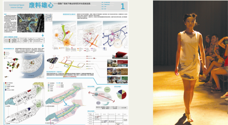
《废料核心——国泰广场地下商业空间艺术化低碳实践》 任宇 指导教师：许亮