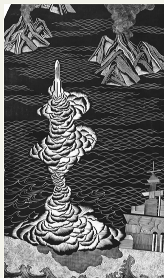
《真实与荒诞共处》 臧亮 指导教师：康宁