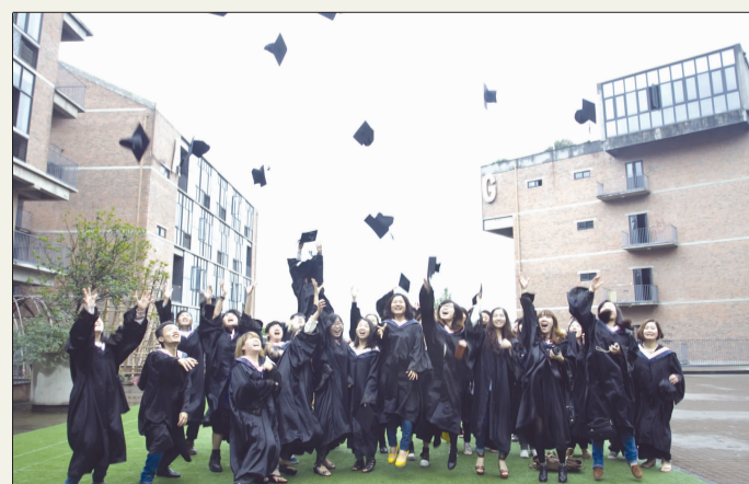
学生助编: 劳立秋 助理美编: 邓立华 校对: 杨 勇 周 俊

快要和学校说再见了,离开这个城市,就这样结束我们的学生生涯。曾经的过往,仿若迷雾中看不清,道不明的熟悉的景,茫然不清却似乎又了然于心。我想这几年来最重要的不是学会了多少技术,而是明白了自己真正想要什么东西,还有如何去做事的态度。毕业创作是一个给我们用尽所能去做一件事情的机会。我自觉这次创作用尽了自己的全力。做得好的地方,令我异常欣喜;做得不到位的地方,感叹之外固然是能力有限的遗憾亦然而有未来拼搏的空白期待。感谢的是,我们在毕业创作中最大限度的坚持,相信这样就是很完美的一次创作。同时也深深明白,不管是做导演还是做摄影师、画家,最重要的也就是坚持了。你不坚持的话,没有人能够帮助你。当我们坚持下来的时候,所有人都能来帮助我们了,有这样的人生体验,真的非常感动。