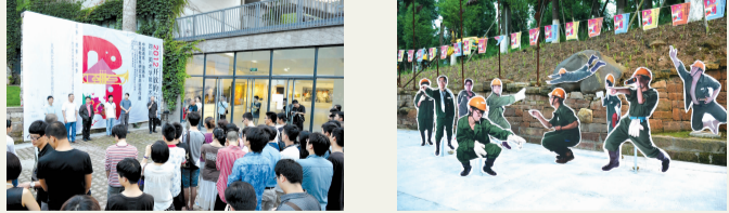
展出作品别具一格

展览“引”市民。作为艺术游的重头戏,分别在大学城校区举行的中国画系、油画系、版画系、雕塑系、建筑艺术系、影视动画学院的本科生、研究生毕业创作展,美术学院系绘画类、新媒体艺术系的本科生毕业创作展以及在黄桷坪校区举行的“川美2012届本科生、研究生设计类毕业创作展”、“商业美术系本科生油画艺术毕业创作展”等一系列展览展出了数千幅形式多样的艺术作品,为广大市民呈现了一场艺术盛宴,让市民在与艺术进行亲密的接触中产生耳目一新的艺术体验。