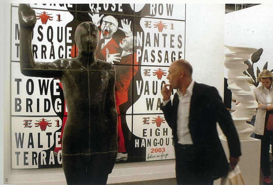
1-7. 巴塞尔博览会展览现场

日，第36届巴塞尔艺术博览会将如期在这座号称“瑞士文化中心”的城市举行。届时，270家来自世界各地的画廊将展出1500多位艺术家的作品；1500多家专业媒体将亲临现场报道；约有50000名观众到场参观。而与之几乎同时开幕的第51届威尼斯双年展将和巴塞尔艺术