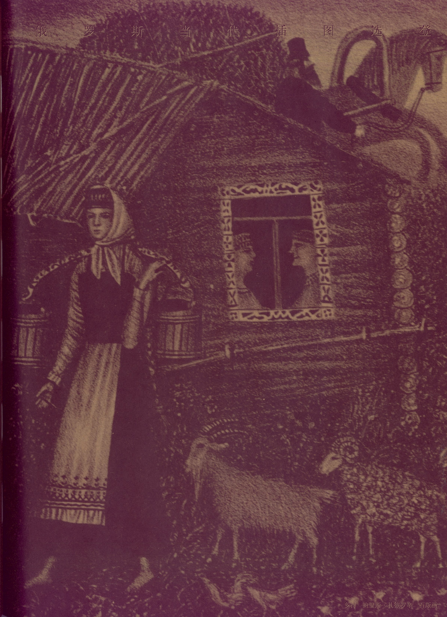
乡村 鲍里斯·扎彼罗辛 石版画