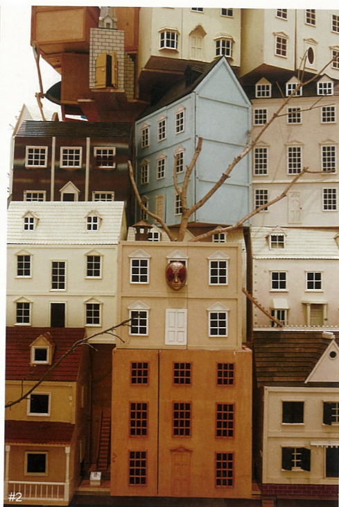
I #1-2 流动美术馆 动画、装置 徐骏骋