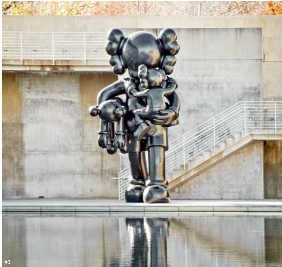
3 卡瓦斯 (KAWS) 重新出发 青铜 高6.4米, 重5606.4千克 2018