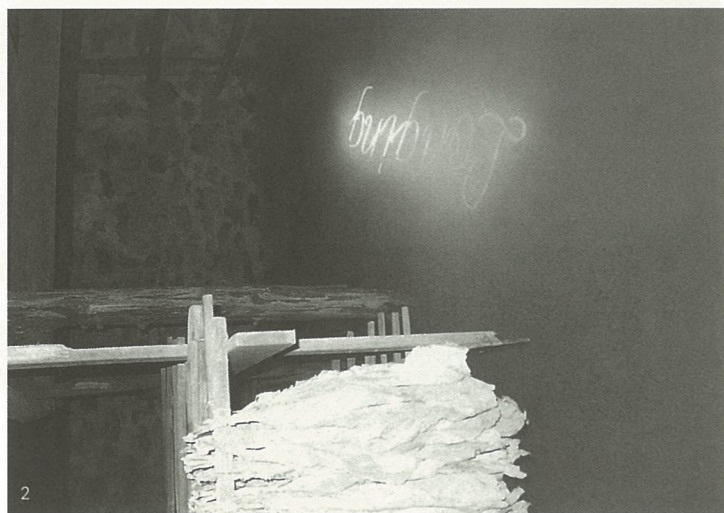
1-2、烟草计划：欲望 徐冰 3、烟草计划：中国精神 徐冰 4、烟草计划：烟草书 徐冰 5、烟草计划：月份牌 徐冰

所谓的全球化进程多多少少像是一场以美国清教伦理为基础的自由资本主义（或者如金融大亨乔治索罗斯所指称的“市场原教旨主义”）的征服天下的霸业。这一霸道的历史总让我以强秦和六国的关系做遥远的类比。如果说伊斯兰原教旨主义者的反抗可以类比为荆轲的恐怖主义，那么海外华人艺术家在国际文化战场上的兴风作浪则更多地令我想到那些善于挑拨离间的纵横家们的作为。他们长袖善舞活跃于文化大融合与大冲撞的舞台上，在各种矛盾和权力的缝隙之间的游戏，既怀揣着建立个人功业的野心，也不乏对母国文明的深情。他们更要用肉身直接承受不适与尴尬，屈辱与欲望，全球化进程中的一切压抑，而不失对于艺术的诚实的怀疑。我对这些人素来尊敬，而徐冰无疑是其中足智多谋的一个。