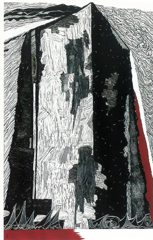
1、开门见喜 版画 戚序 2、百年隐痛 版画 戴政生 3、口红 丙烯 易丽君 4、古韵遗梦 丙烯 沈晓虞 5、无题 油画 刘沛沛 6、淡水 丙烯 韦嘉