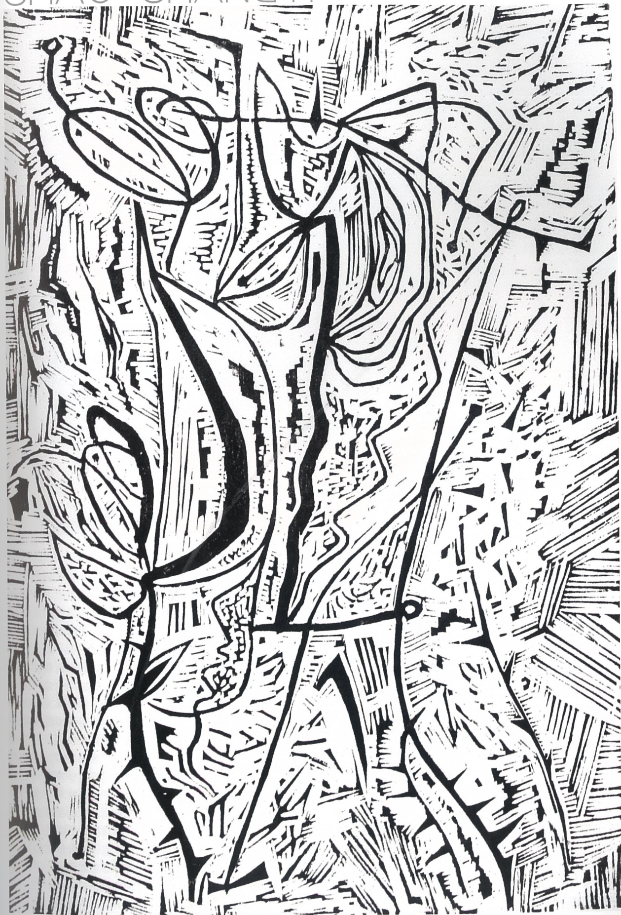
邵常毅 带刺的玫瑰 黑白木刻 400x270mm 2003年