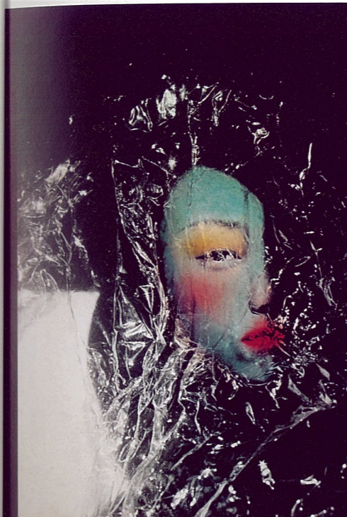
《透明帘系列之二》 陈可 12寸黑白照片着色 20 × 30cm

按我个人的情趣，希望把深浅（包括）冷暖的对比尽量减弱，直至难以觉察。但可以凭心感受是我的理想，提供冥想的状态该是幽幽的吧！我近来的画暗部都加入了白色，或者惧怕太深对比过强习惯用白色薄染，特别要想让繁复的树枝或肌理服从于非光源的深浅变化时。这种变化我期望是极度柔和的，是通过一层又一层在同一区域加同一意念逐步达到的，便不能轻易看见只能感觉到，接近完成的同时画面越显得干净，或者说敏感，增减细微的笔触都能被轻易发现。一种被风吹过的“质感”平整而易感，但绝非光滑油亮，最后都变成一种痕迹，将被蚀掉的痕迹。一种隐秘的难以言喻的快感，支配着努力实现并非在任何环境任何心情任何光线下都能见到的痕迹。