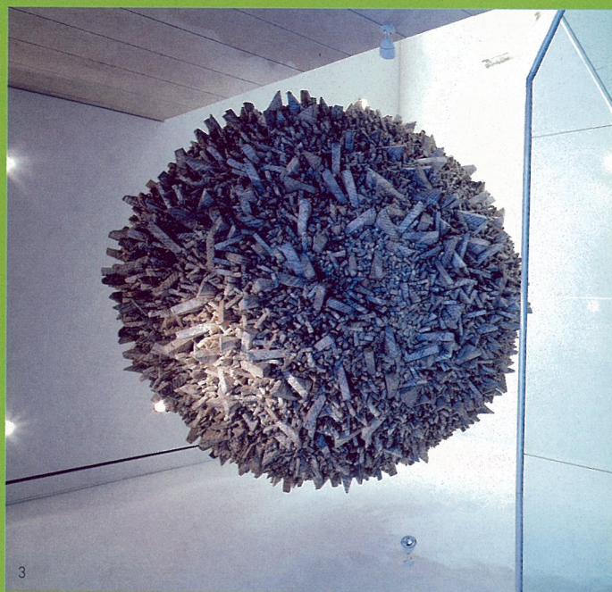
1. 米斯法老王 油画 乔纳森·米斯 2. 麻雀 雕塑 达伦·拉戈 3. 集合001-MY056 综合材料 全光荣 4. 无题 印第安墨、水彩、蜡彩 马塞尔·迪热玛

在雕塑作品中,来自德国的雕塑家朱莉娅·曼格德(Julia Mangold)将一组矩形元素焊接在一起。而在类似的壁雕《O.T. 21.2.00》中,她再次遵循严格的几何格式,充分体现了她对比例及平衡天生的敏锐。