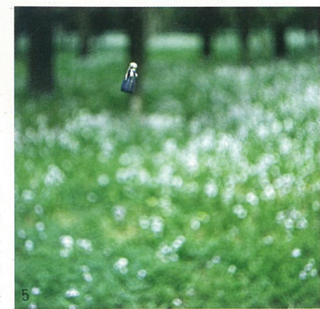
1、无题 综合材料 顾德新 2、幸福童年 综合材料 刘野 3、红色娘子军 动画 冯梦波 4、旗舰的沉没 综合材料 刘野 5、小木木1 综合材料 蒋志