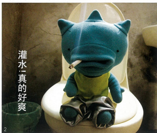
1、无题 油画 孔蔚蒙 2、灌水空空 综合材料 熊文运 3、无题 油画 孔蔚蒙