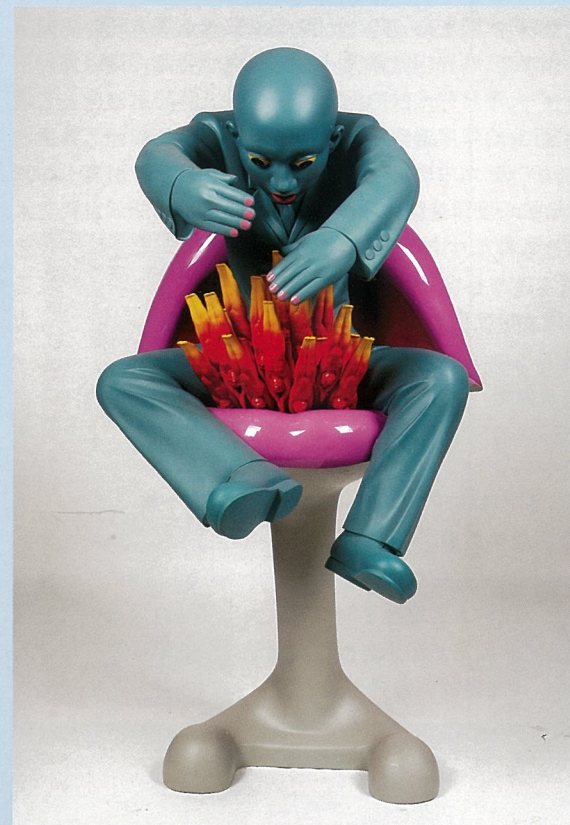
凹 雕塑 唐勇