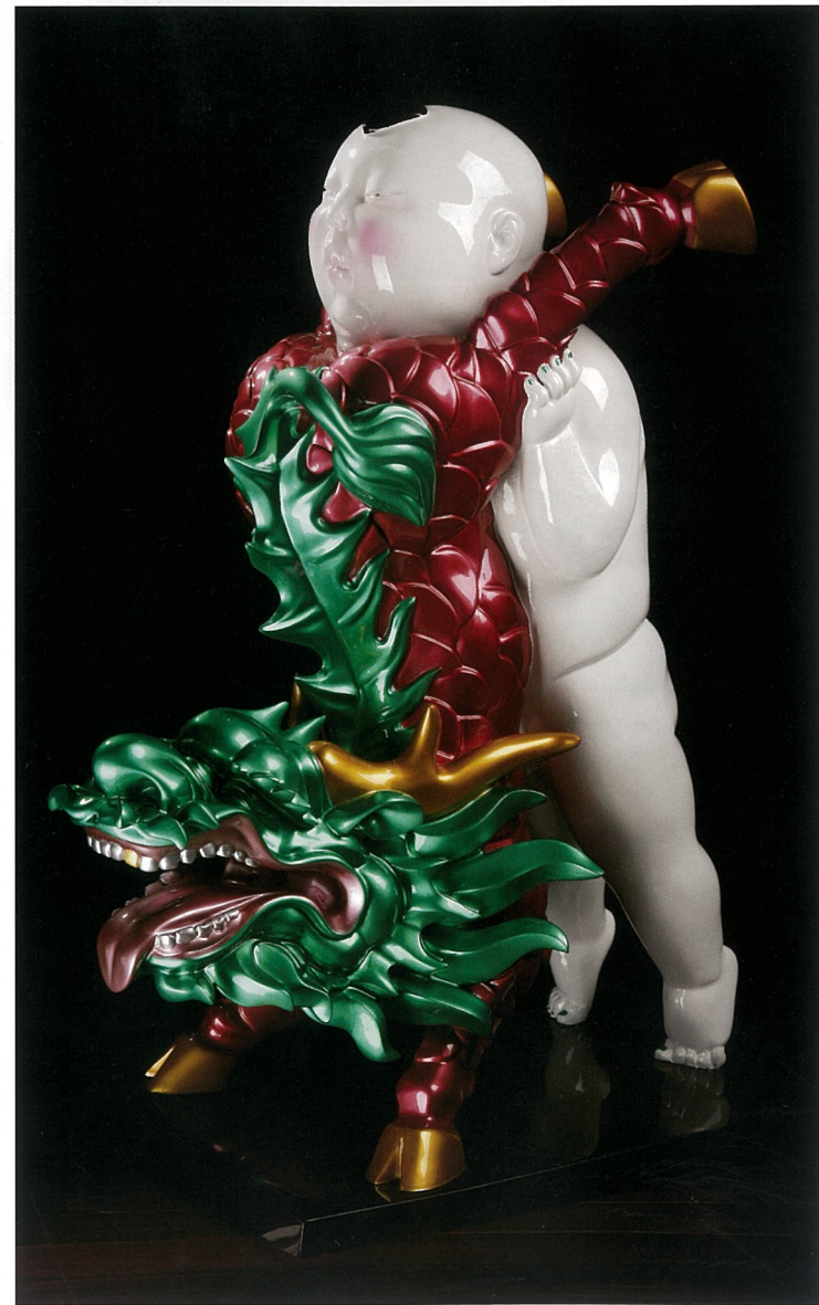
负片1号 雕塑 肖时安