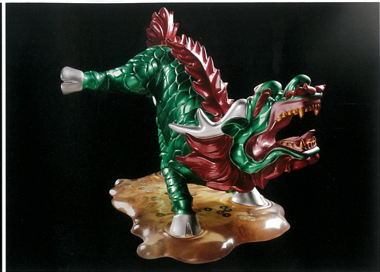
负片3号 雕塑 肖时安