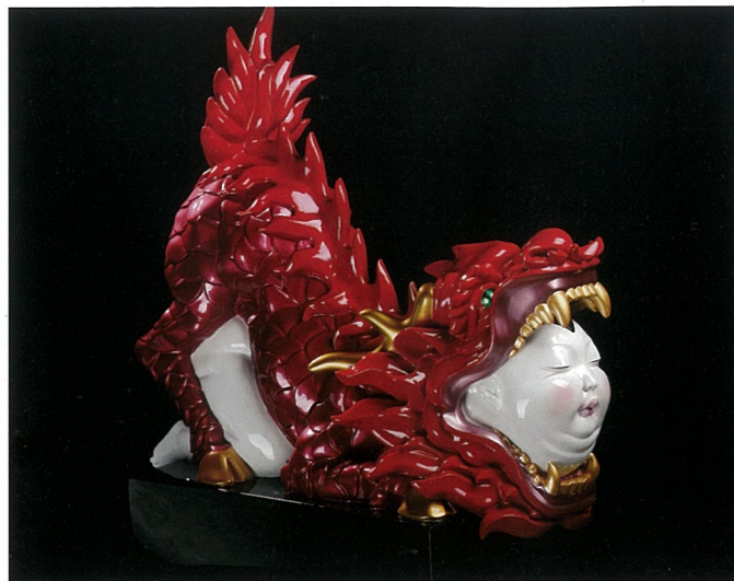
负片2号 雕塑 肖时安