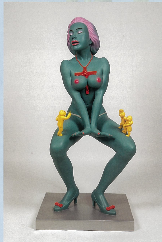
平台 雕塑 唐勇

雕塑中的小人以形造势，隐喻着一种价值观念。小人国童话故事里的人物以一种特殊的符号样式介入作品之中，用滑稽、幽默、惊恐的形象特征去解读、重构生活、生存的价值与意义，去寻找生死之间的秩序，去消解沉重、苦涩的现实状态。并在凝重的语言表达中获取一些轻松、愉悦的视觉快感。（节选）