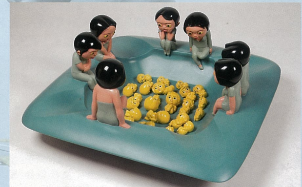
湮灭 雕塑 唐勇