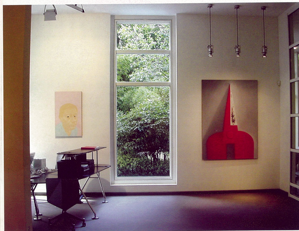
1、我们 油画 余友涵 2、纳瓦拉画廊 油画 刘炜 3、我是谁 油画 刘炜