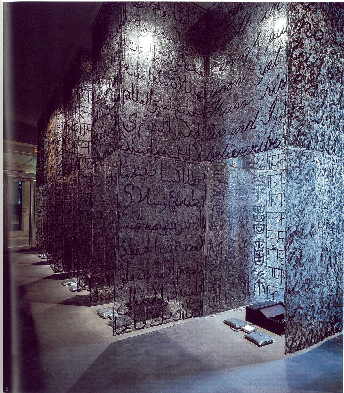
1. 纳瓦拉画廊 2. 丝绸之路 装置 谷文达

对此，我们专门对巴黎四家致力于推动中国当代艺术的画廊及其总监进行了采访，涉及到画廊对艺术家的选择、对中国当代艺术的基本评价、对艺术家进入国际艺术市场的建议等诸方面的问题。虽然所谈有限，相信展览之下的这种直接交流对话会为我们审视中国当代艺术提供一些新的视角和思路。