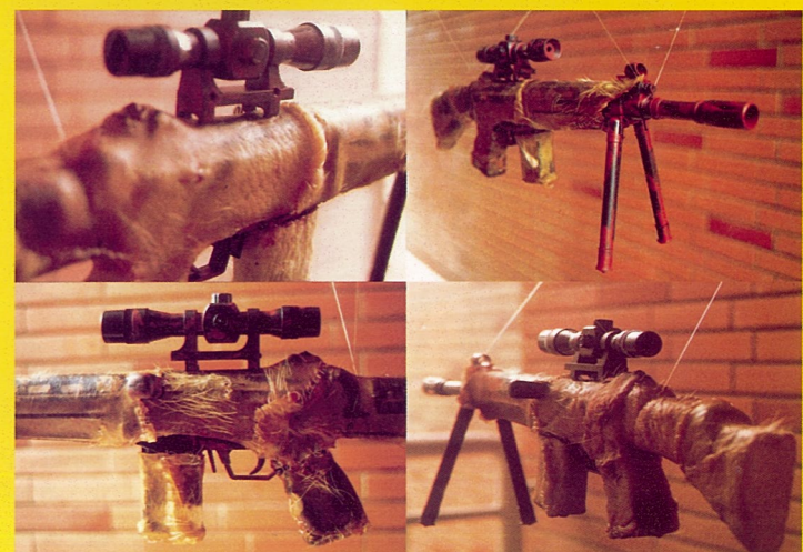
The Gun The War 徐静君 塑料枪、新鲜猪皮、鱼线