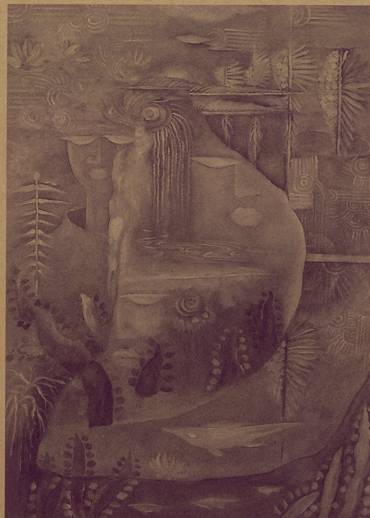
景观·三号 刘丽 布上油画

我又回去上了几周进修班的课，在这个班，我接触到几位对学习怀着十分执着精神的同学，首先是冯琪，她迷恋油画艺术，对传统的油画技艺，她决心要努力去掌握它，在作业上为达到心中理想的境地，她总是努力去寻找、探索，不厌其烦地反复修改，有一股不达目的决不罢休的精神，从作业上我感到她在极力追求油画上的浑厚感和肌理感，并常以非常强劲的笔触来表现她对形式的追求。《女人体》这件作品，可以看出冯琪在掌握油画技巧上取得的进步。这件作品构图简洁，主体鲜明，对女人体的色、光、体的塑造比较充分，同时她还有意识地注意把握较为圆润的女人体与自由粗放白衬布间的对比，其四周的浅灰色也恰到好处，使主体形象更为鲜明突出，整个画面在色彩构成上非常典雅。在这件