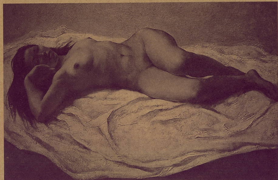
女人体 冯琪 布上油画