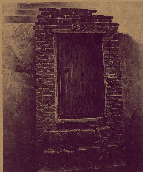
老门 冯琪 布上油画