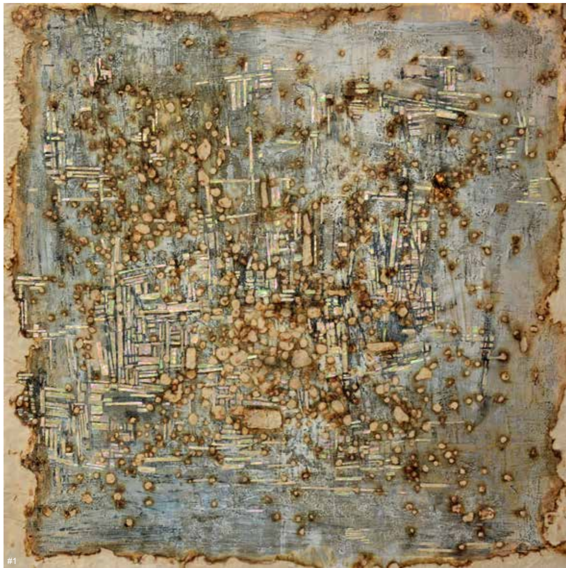
1 王玲红 烧痕残碧尽 综合材料 80cm×80cm 2019 2 王玲红 涧闻林鸟跃 漆综合绘画 80cm×115cm 2018