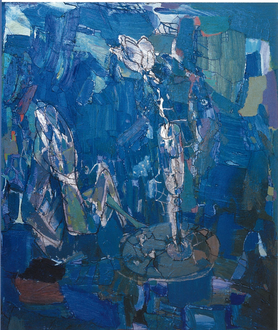
对视 斯维特兰娜·帕诺玛莲柯 油画

向进行，例如「知识性专业活动」「高等教育和普通进程」「人与环境系统的建筑和科学组织」「俄罗斯民族的社会经济文化力量的保存与发展」。学院有研究生部和一个由专家组成的论文评鉴委员会。