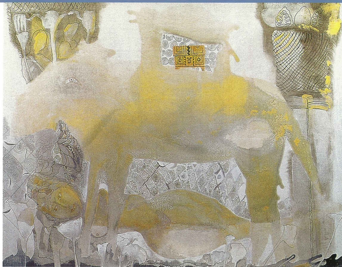
丝绸之路 斯维特兰娜·帕诺玛莲柯 油画