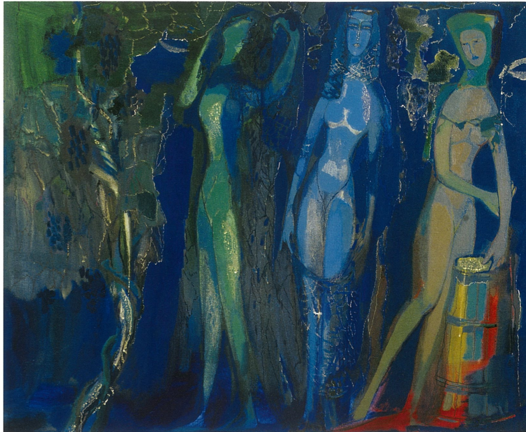
南方 斯维特兰娜·帕诺玛莲柯 油画

学院的课程设置是六年制教育、艺术学士(四年制)、艺术硕士(六年制),教育计划包括以下几个循环:人文基础学科艺术、基础学科、特殊纪律。为了增强学院的科学和理论基础,复兴传统专业,掌握电脑运用技术