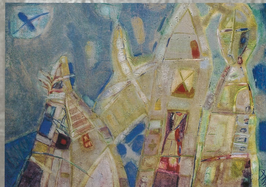
远方 阿里克塞·达拉修克 水彩