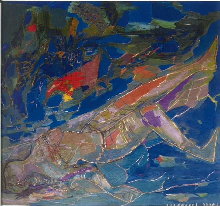
飘 斯维特兰娜·帕诺玛莲柯 油画

以适应信息和广告领域的社会要求,学院90年代增加的专业课程是十分必要的,它有利于教育跟上时代的要求。