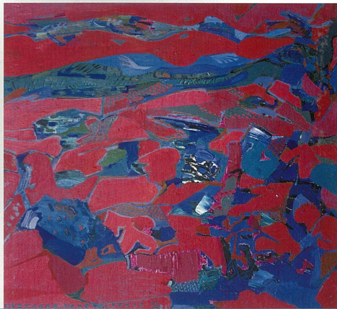
云 斯维特兰娜·帕诺玛莲柯 油画

合并,从1953年起,该院被命名为苏维埃穆亨娜国立艺术设计学院。由于第二次世界大战刚刚结束,该院的首要任务是培养修复在战争中被破坏的建筑的维修人才。教师、学生和毕业生为列宁格勒的文化遗迹及城市建设做出了巨大的贡献。