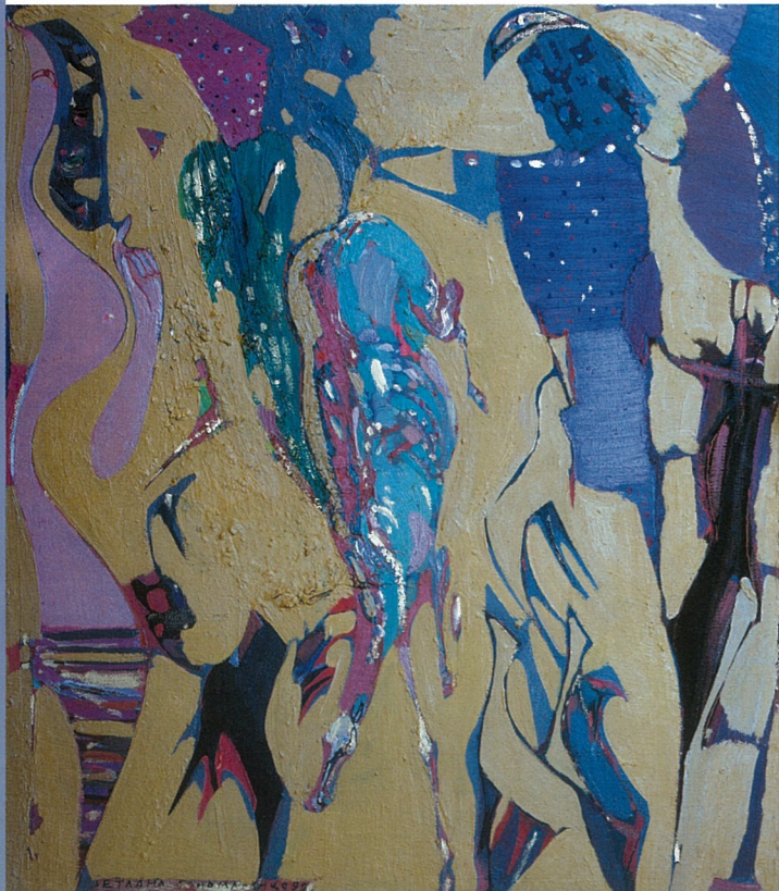
舞蹈 斯维特兰娜·帕诺玛莲柯 油画