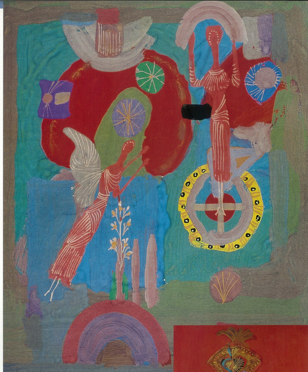
天使 奥列格·库兹内佐夫(教授) 丙烯

我们在观看了该院师生作品后，深感穆亨娜国立艺术设计学院教师不仅在创作上具有相当的才能，而且在理论及教学方面也显得十分出色。在学院不定期的各种学生作品展览中，不乏有很多实验性和宗教意识的作品，这些实验性的多种艺术实践，不仅不会受到校方和教师的干预，而且还能得到教师在艺术问题上给予各种鼓励和引导。所以我们在参观该院时看到的是十分和谐的师生关系。