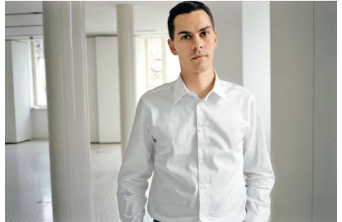
第54届威尼斯双年展总策展人massimiliano-gioni

总策展人乔尼的设想，来自于上世纪50年代意裔美国艺术家马里诺·奥利迪的设计理念——该概念描绘了百科全书式的宫殿，它是一座虚构的博物馆，汇集了人类最伟大的发现：从轮胎到卫星。尽管奥利迪的设想从未实施，但这种对世界文明愿景的奇思异想，在人类进程中从未缺席，许多充满想象力的艺术家、文学家、科学家，甚至是预言家，均知其不可为而为之，希望构造一个映像世界，来展现它无尽的变幻和内涵。这些打着个人色彩烙印的宇宙观，尽管有着全能全知这般错觉的局限，却给后人了解如何调和诸如宇宙与自我、个体与群体、特殊性与普遍性、个人与时代这样的矛盾带来了启迪。