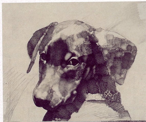
狗 程丛林 素描

留20-30分钟实际上就产生出缓慢的节奏。 注二：这个完整方案的实施，由可操作与不可操作两方面对接而形成。在可操作部分的硬体设制上，墙的长宽高如何与可利用场地空间结合？通体的颜色红到什么分寸？用60w、40w还是25w灯照明？画与灯照之间的角度？使用什么木条和板材？画与画之间的归纳与排列？如何固定镜框？等等具体问题都是可操作环节。不可操作部分指观看和感受艺术的人是自在的。他们完全随心所欲地停下来看和走动。尽管在画的排列上多多少少可以调剂一下观者移动的节奏，但每个人偏爱不一使得注意力分配有很大差异。你不能也没必要去控制它，那是一种自然行为，正是这种天然的关系中暗含着艺术现场的张力。