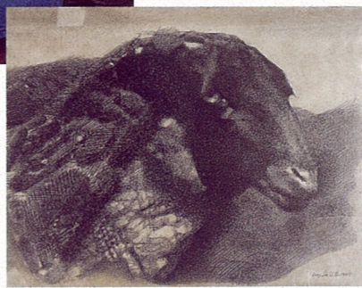
羊 程丛林 素描