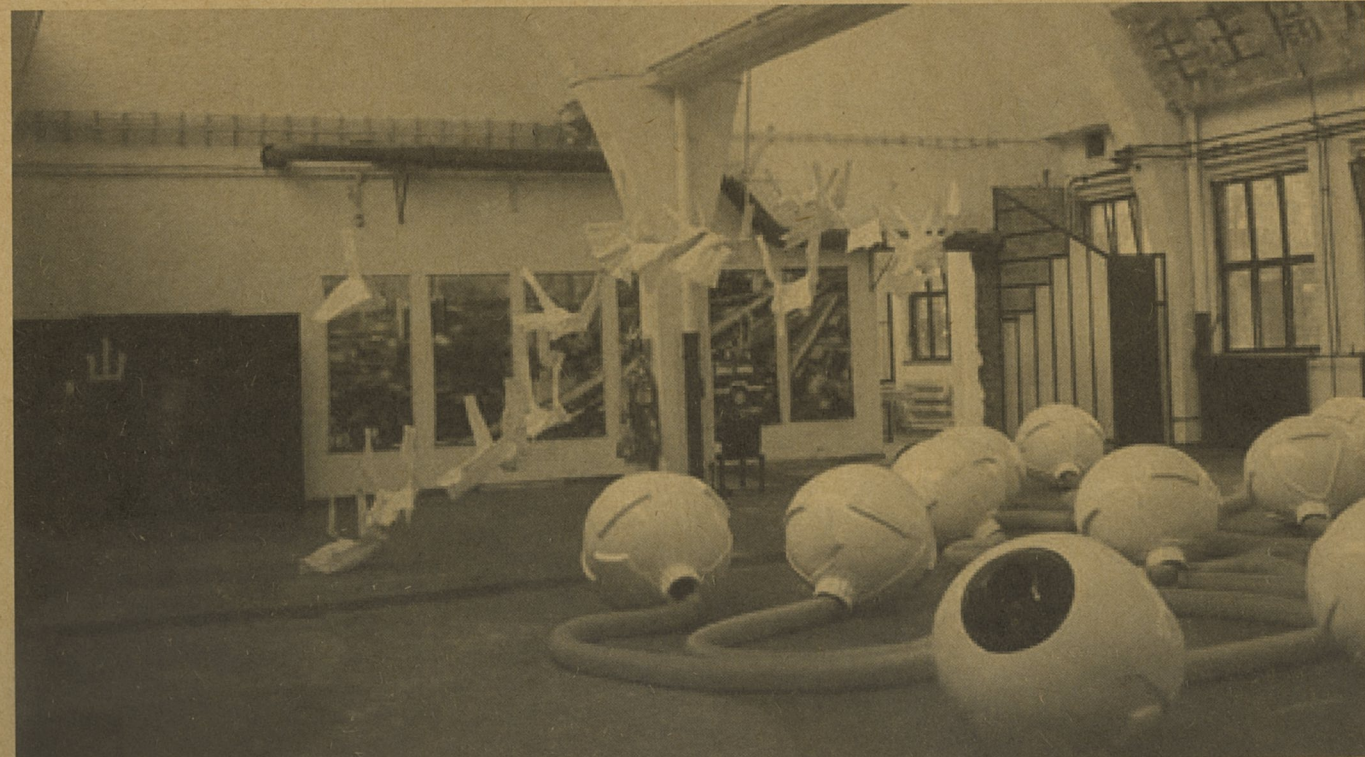
交互端口：眼光 宋东 影像装置

“北京”是中国的首都，作为中国政治、经济、文化及交流的中心都市，集合着目前中国都市文化的典型状态和未来趋向。尤其是已成为中国当代艺术展事活动的发生地和一大批来自各地的活跃艺术家的聚集地。从某种角度来说，现代化的过程，也就是都市化过程。中国是目前发展势头最强的国家之一，一方面每个人似乎都获得了比以往的相对自由，民间空间发展的可能性愈来愈扩大，另一方面原来的历史记忆与经验以及意识形态又无处不在，交织在一起的世俗图景，又决定了现实生存的不可超越的宿命。而作为社会都市化产物的大众文化的兴盛，是以都市普通百姓为主要受众的，这种非神圣而日常的，强调感性愉悦的文化形态与日本江户时代的“浮世绘”所提倡的“浮世”精神，有着某种内在的相关性。