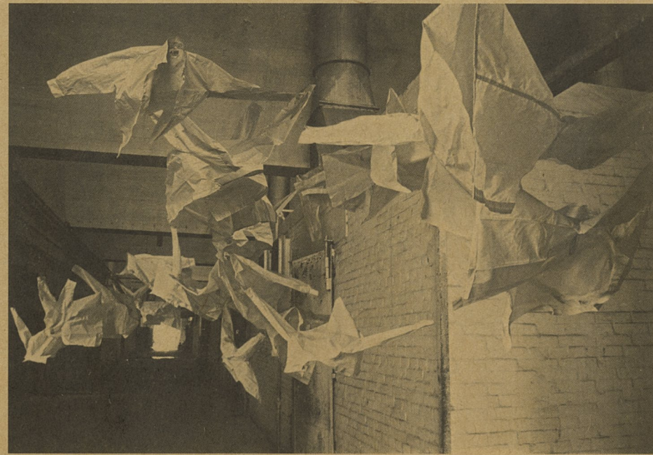
飞行器 马晗 声音装置

黄锐选定“新北京”的“购物八景”以取代“老北京”的“燕京八景”。并请四位女模特身着标志清朝贵族的正黄、白、红、蓝四旗的服饰，在购物的行为过程中，以“花钱买感觉”的方式，体验和反映出中国目前在购买动机和消费文化取向上的变化。当观者反复与这些模特相遇之后，不能不思考所指向的现实内容。夸张生动的行为表演性和虚拟性提示出这个时代精神崇拜的荒诞情境，戏谑的背后隐含着的是严肃的反思。