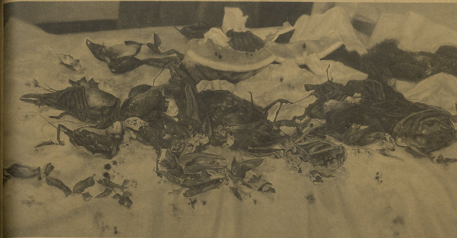
116楼310房 张小涛 油画