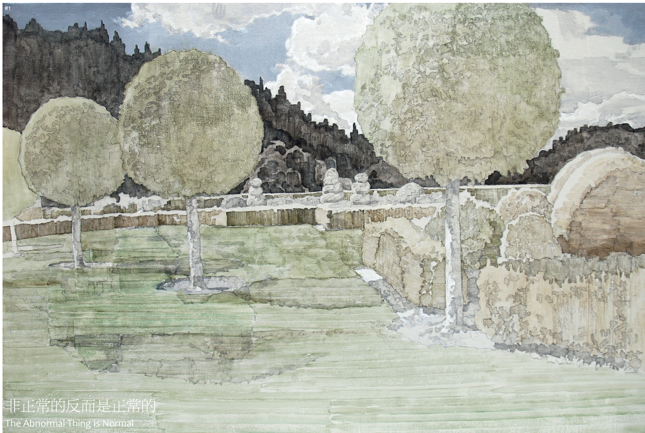
#1 非正常的反而是正常的 The Abnormal Thing Is Normal