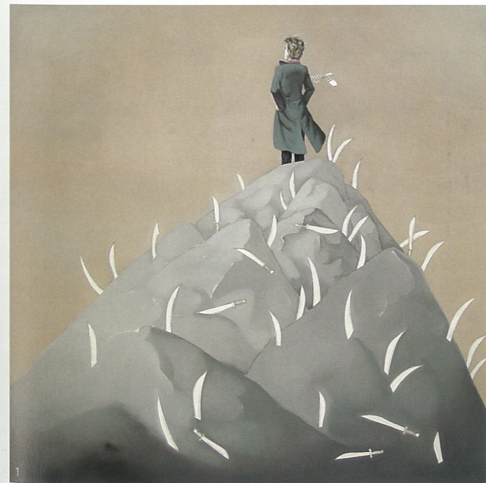
1、刀山 油画 范安翔 2、以舞台的名义NO.4 油画 刘玉洁

杜伯贞：大概是因为工作的原因，我从亚洲文献库的工作经历以及所收集的信息中感受：中国当代艺术的发展其实还有很多应该去努力的环节。艺术市场火热的另一方面，是批评的滞后、基金会的缺失、收藏的混乱，甚至我不知道要怎么认识这里的非营利机构……所以，年轻艺术家在一个什么样的背景下成长，就成为十分重要而关键的问题，因为这关系到他们怎么从事和看待艺术。“罗中立奖学金”也许并不能解决中国当代艺术的一些问题，但它让一些刚刚从学院里出来的年轻艺术家，有一个可以交流、展示的机会，这会是一个良性的鼓励。同时，评审团队非常的专业化，也并没有要求我们要遵从从一个