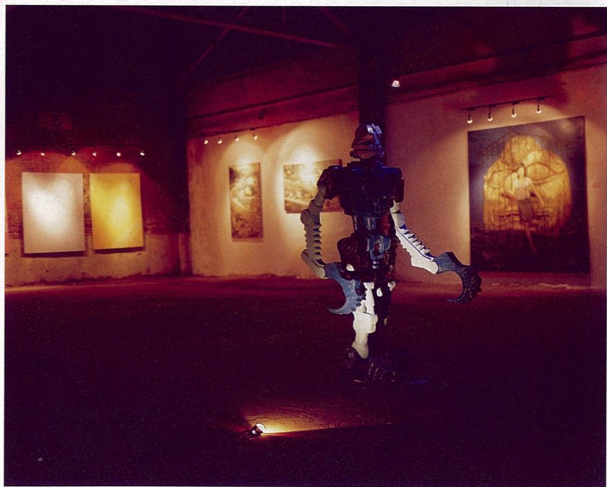
机器人 杨墨 装置