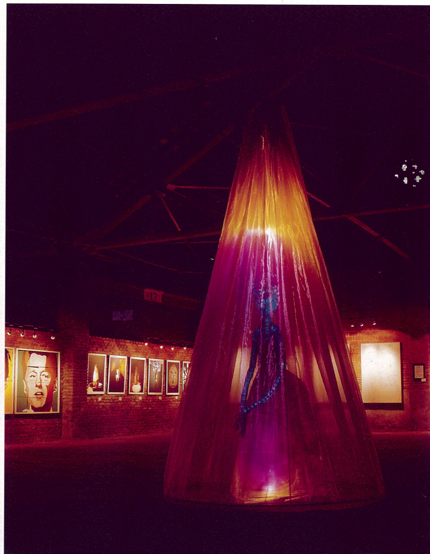
2978 杨鲁帆 装置