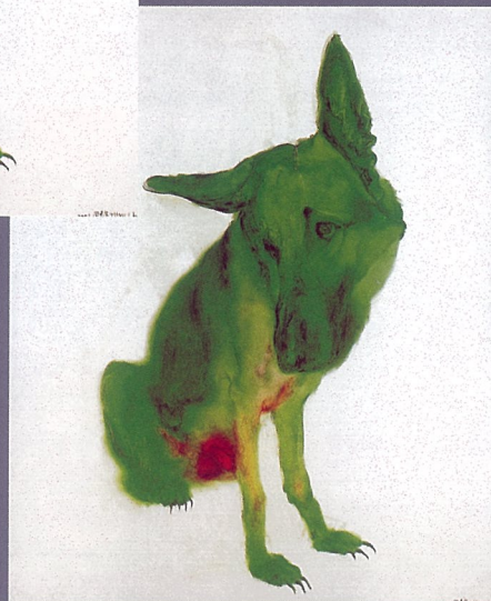
绿狗系列-2001年10号 周春芽 布上油画