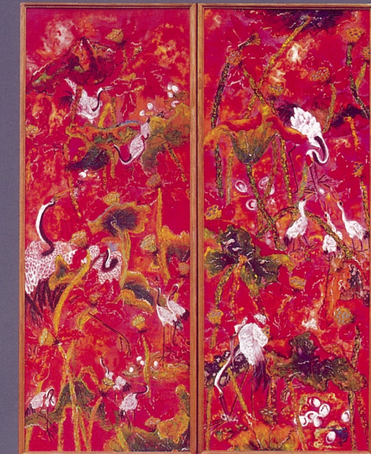
游离呼吸No.1 组画 刘敬伟 中国画颜料，丙稀，宣纸