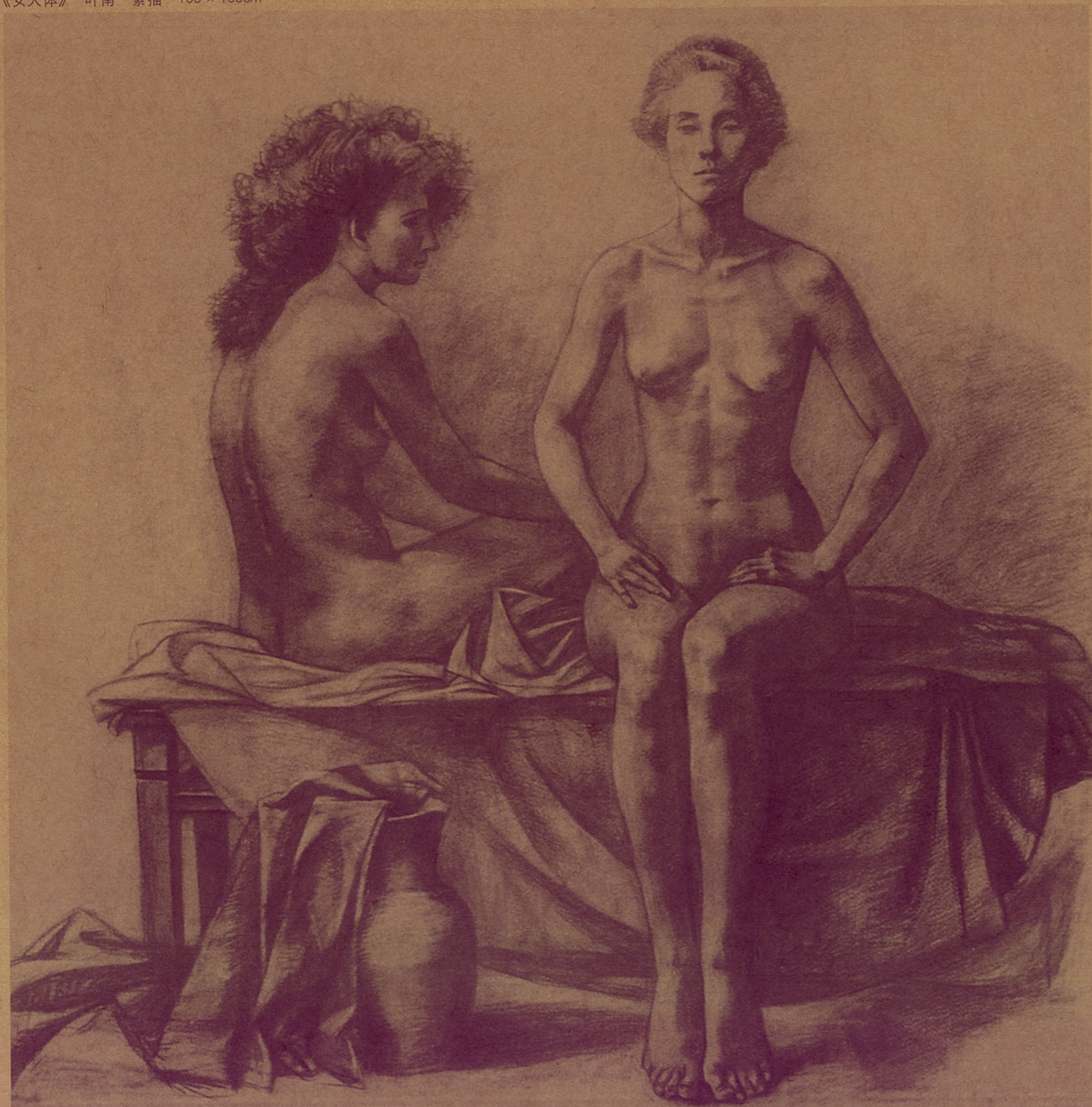
《女人体》叶南 素描 100 × 100cm