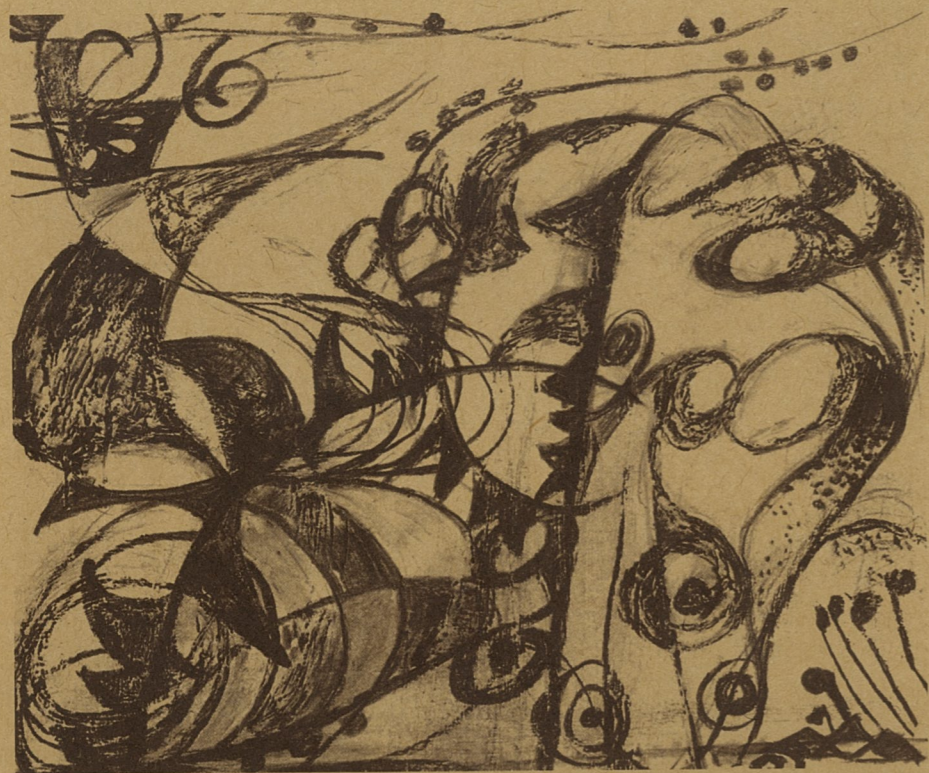
梁山伯与祝英台 罗楠 素描