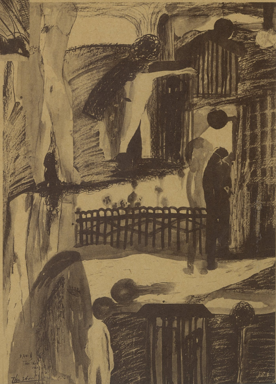
城市之夜 陈青 素描

在瞬息万变的今天，符合艺术教育规律的改革工作始终有得做，唯其如此，才能紧随时代。