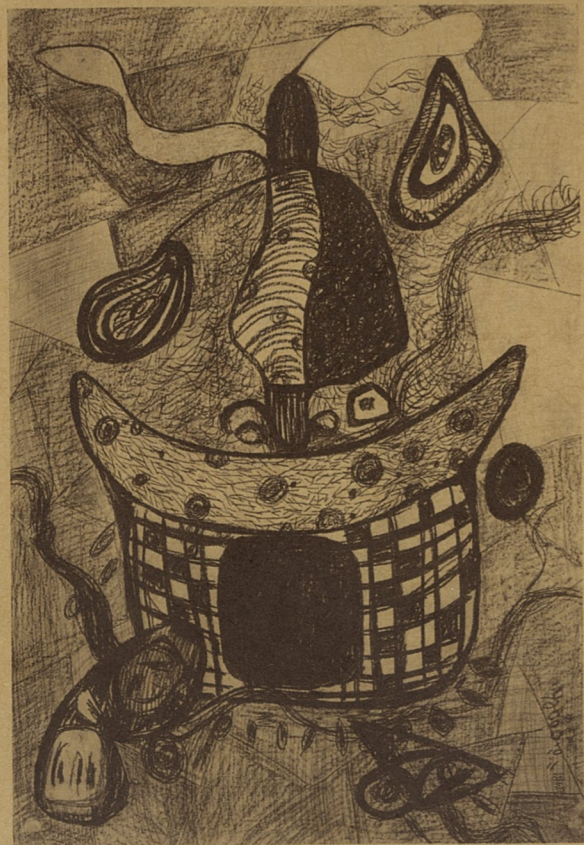
无题 汪玉斌 素描