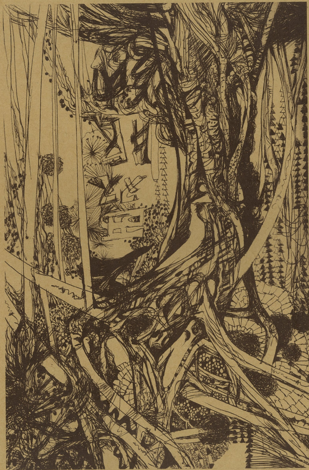
热带雨林意象 黄越 素描

时下常常听到对学生素质差的感叹。想想77、78级那些学生，既有天赋又有写实能力，同时也有相当的社会经历。的确，由以前的精英教育变为了现在的普及教育，三五十个人一届的招生人数一下子猛增到八九百人，而且全社会都在招学美术的学生，社会上哪来这么多优秀生源？显然情况发生了很大的变化。