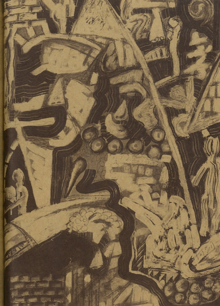
无题 何剑 素描