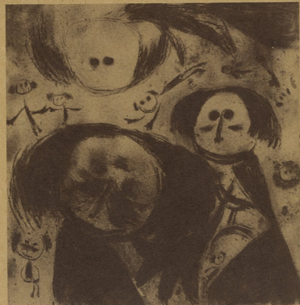
老人 唐淑英 素描