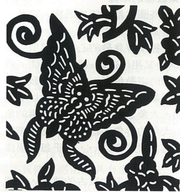
上 牡丹與蘭草 左 蝴蝶圖案