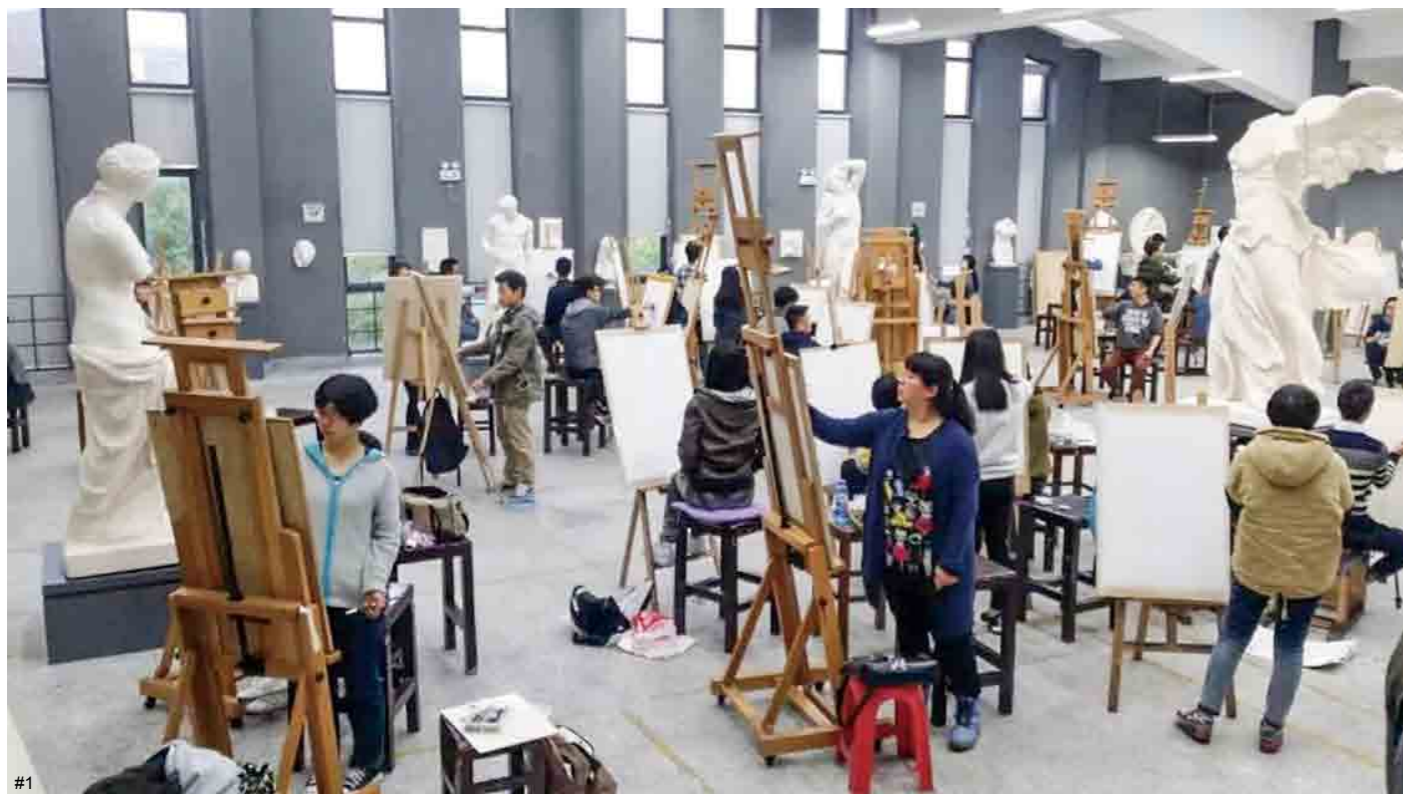
1 大一学生在基础课部石膏馆 教学现场（2012）