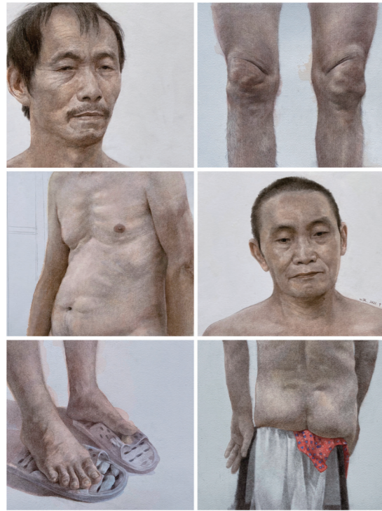
1. 王建蕊,《方寸之间-人体语言》,尺寸可变,纸本素描,2021年,指导教师:陈树中 四川美术学院油画系第十届基础作品年展一等奖作品