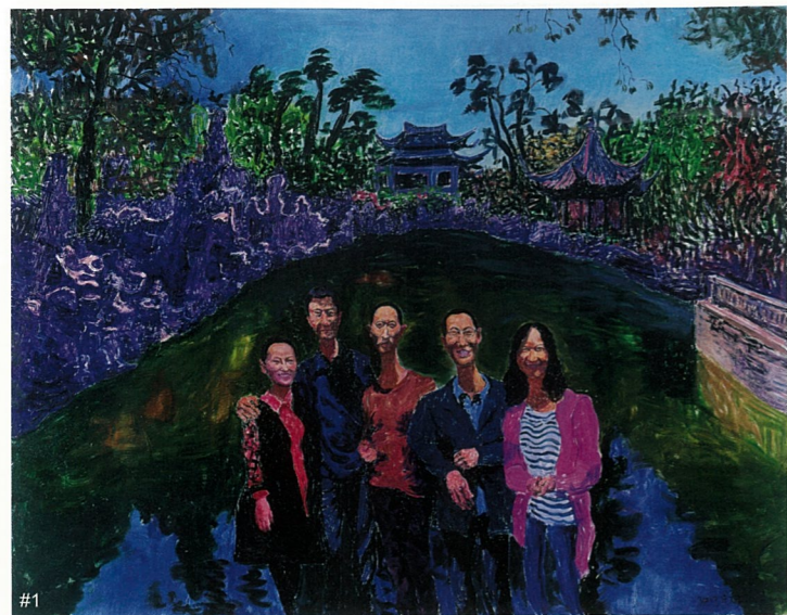
#1 游个园 布面油画 周春芽