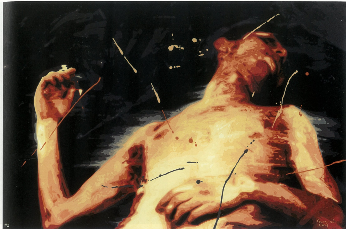
#1 塞巴斯蒂安 布面丙烯 郭伟 #2 传说的英雄 布面丙烯 郭伟 #3 疑问一 布面丙烯 郭伟

“艺术长沙”是由谭国斌当代艺术博物馆发起，与湖南省博物馆共同推出的具有全国重要影响的文化艺术品牌。它以陈列展览、艺术交流为载体，每两年举办一次，活动内容包括汇集中国当代著名艺术家的作品来长沙展出，邀请国内外的艺术家、艺术评论家、艺术经纪人以及博物馆（美术馆）界、收藏界的专家学者来长沙开展当代艺术的学术交流研讨，国内外的媒体参与报道，旨在展示中国优秀的当代艺术，促进当代艺术的繁荣发展，也为长沙建设具有国际影响的文化名城与创意中心营造良好的艺术氛围。