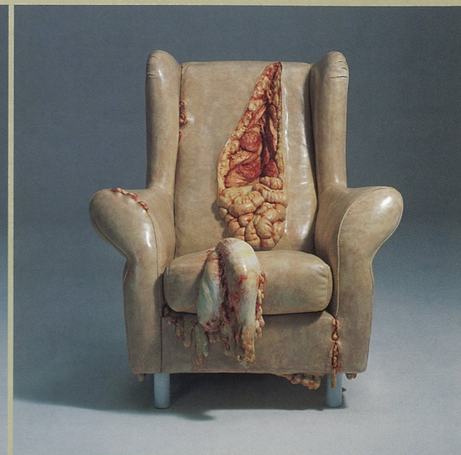
可视的体温之二 树脂、纤维等综合材料 曹晖