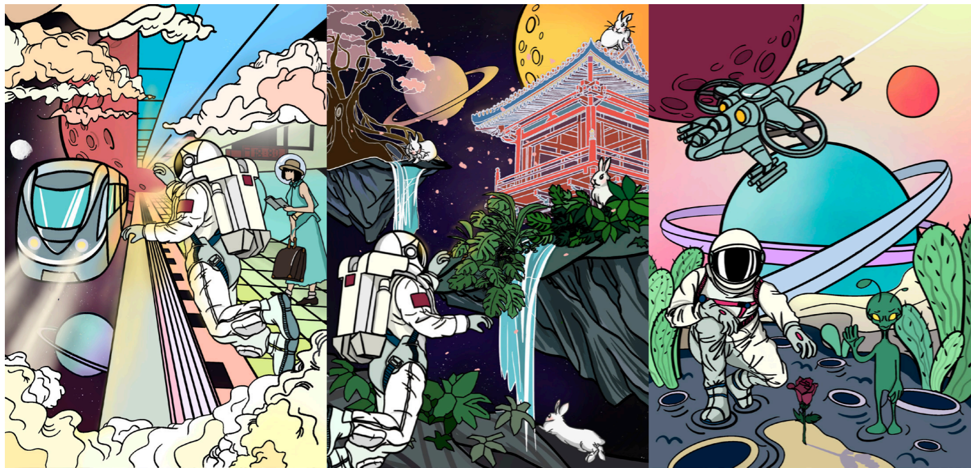
4. 吴祖凤,《太空旅行计划》系列,插画设计