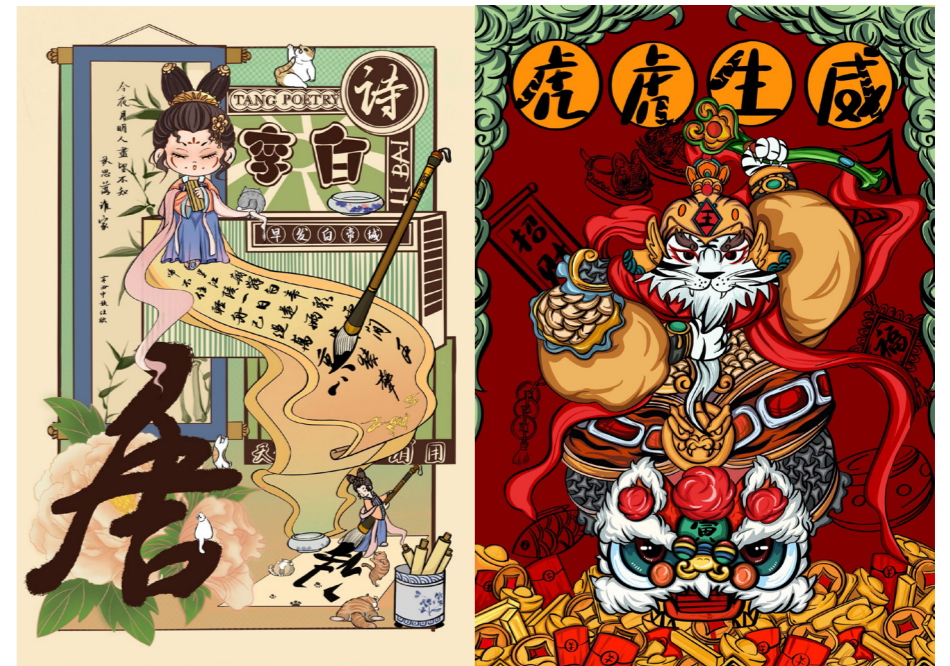
2. 覃慧,《唐诗宋词》,插画设计