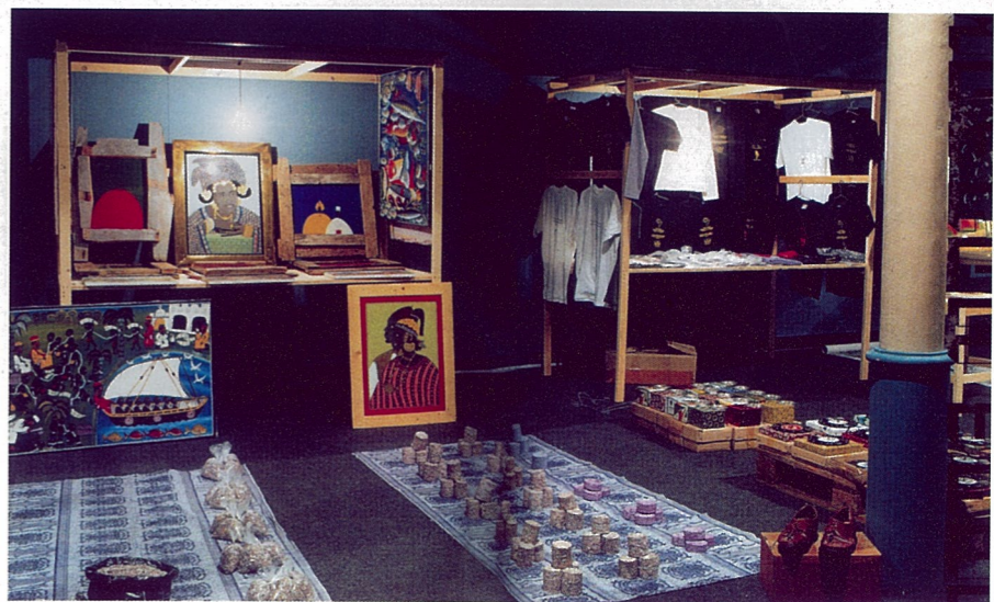
当代非洲艺术博物馆 麦斯夏克·加巴 装置