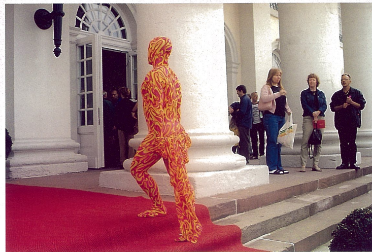
展场外的行为艺术