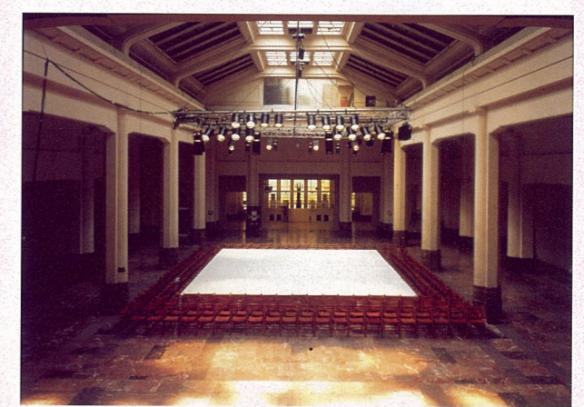
一张桌子 克瑞基·荷斯菲尔德 装置