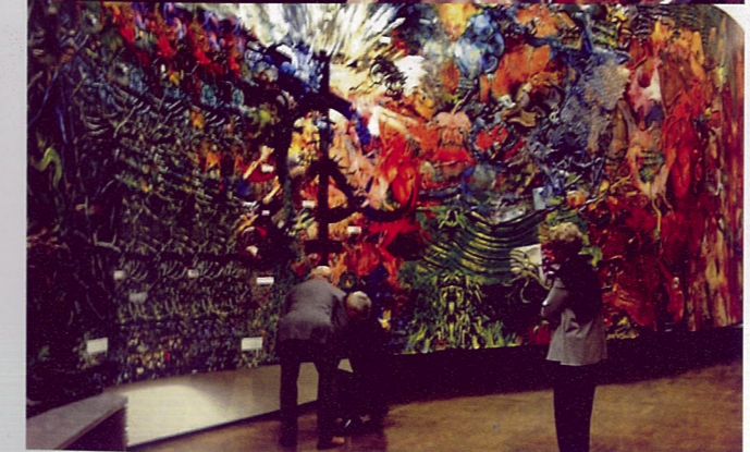
绘画的故事 费宾·马卡什欧 综合材料

装箱，再到展览现场，表现出“不适当当下语境”的质疑。从这层意义来看，恩威佐设置的论坛为新的展览模式所提供的思想资源正好配合了策展人面对未来的探索态度。同样也为今天的博物馆找到了一种新的定位。这不由使我联想到2000年侯瀚如主持的“上海双年展”，他也是在一种传统展览制度中，极力寻求出路和探求与世界文化相交流的实验性展览，但我们并未继续这一工作，这是令人遗憾的。如果我们能详尽地研究侯瀚如的策展理念并吸取他所提供的不同于过去的科学信息，那么我们与世界艺术的对话就会更容易一些。