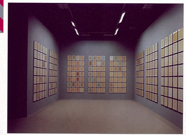
辞汇之书 埃克·邦克 装置

另一方面，文献展在围绕展览主题而展开的近百分之七十的作品，使我们对过去传统的展览方式也就是从工作室，到飞机场，到托运的集