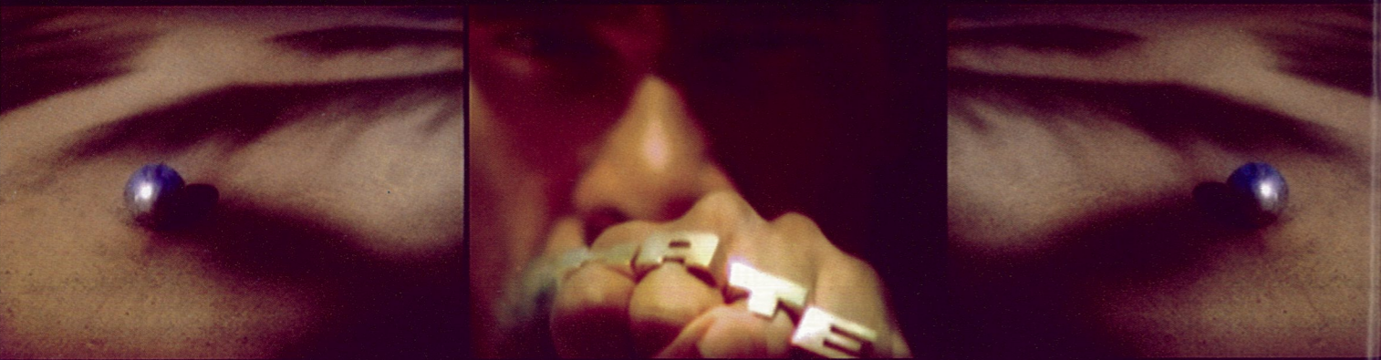
天堂 伊沙克·朱利恩 电影、静物

This wall is the property of the state. It is strictly forbidden to affix posters or paint signs or inscriptions on this surface