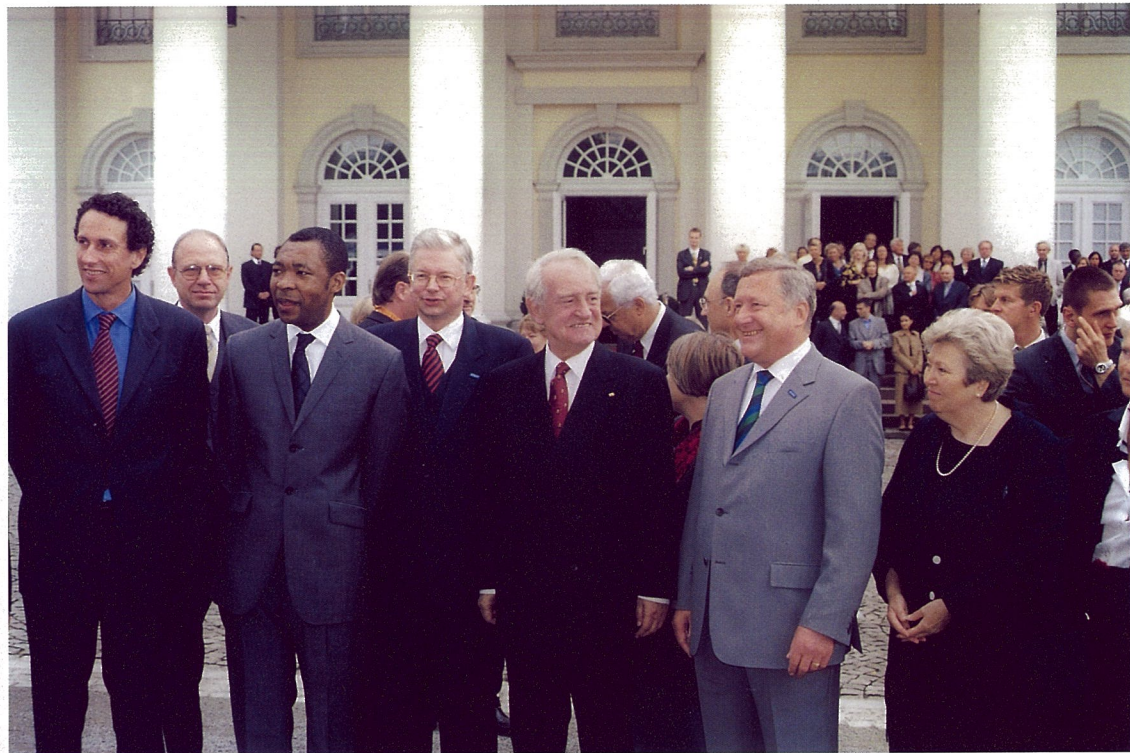
德国总统、财政部长、黑森州州长、卡塞尔市市长、欧奎·恩威佐等