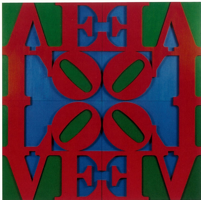
爱之墙 丝网版画 罗伯特·印第安娜

有不同解读意义的展览。从机制的角度来讲，私营美术馆和画廊是难以做到完整的功能的，它们的机制是不严格的，如果要在研究、收藏和教育等各方面都进行，会有一些困难。其实，一个美术馆并不是那么好做的，很多人以为盖了一个几千平方的房子，里面放上一些艺术作品，它就是一个美术馆了。美术馆的要求是非常严谨的，比如一个美术馆的出版物就代表着这个美术馆对于艺术作品的判断。因此对于中国的美术馆来讲，对艺术品进行收藏研究再进行宣传、保护和推广，最终把好的精品艺术介绍给市民，这其实是把公共文化资源的共享权利分配给每一位市民，对一个美术馆来说，这就是它的工作。这种文化意识对于美术馆建设来说是十分重要的。