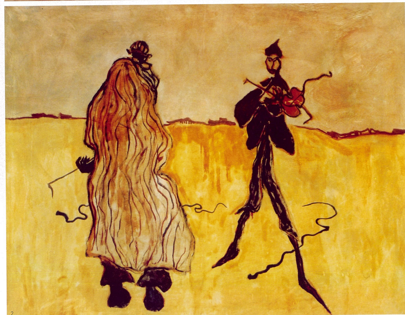
1、两辆手推车 油画 路易斯·克拉瑞门特 2、迷人的蛇 油画 路易斯·克拉瑞门特 3、与佛里达·卡罗的内部谈话(剪短发的自拍像) 摄影 森村泰昌