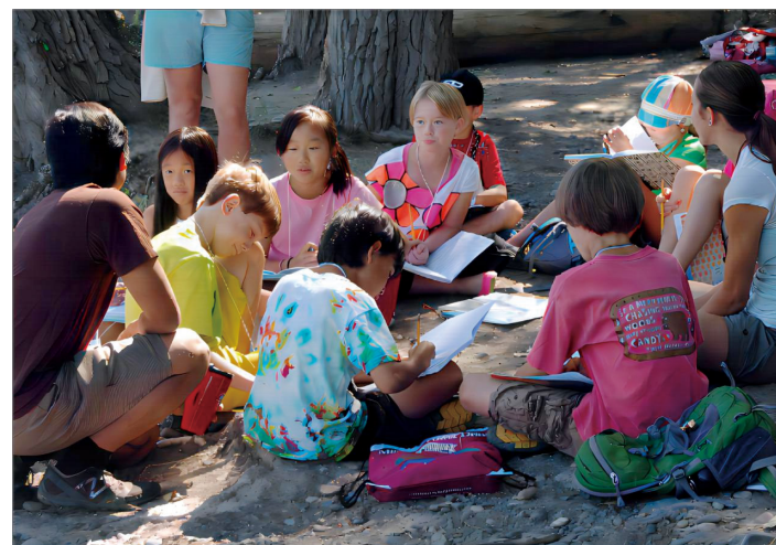
4. 社区创意写作项目“书写生活”，图片摄影：玛吉·古德伯恩（Margie Goodburn）图片来自2012年美国国家艺术基金会年度报告，网址： https://www.arts.gov/about/publications/2012-annual-report