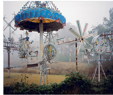
1. 沃利斯·辛普森的旋转作品集

决议中肯定了“风化的普遍原则和对多元信仰及美国公众价值的尊重”，最高法院认为政府对“艺术自由”的支持需要建立界限，需考虑道德要求、宗教信仰和主流价值观，“多样性”之间应彼此尊重。“文化战争”对NEA的影响一直延续到21世纪：面向艺术创作的直接资助大幅减少，更多预算份额向州和地方艺术机构倾斜，尤其是艺术组织和艺术服务不足的社区，还为特别薄弱的农村和市中心地区设立了专项项目。2000年后，“加强社区艺术” [5] 帮助饱受争议的NEA重新在国会中得到认可。众议院的杰洛德·纳德勒（Jerrold Nadler）在表态支持增加NEA预算时就说：“资助艺术是政府做出的最好投资。” [6] 这种投资的价值在于“艺术代表了美国认同和遗产的核心部分”。 [7] 面向社区的艺术资助在“地方性”表达中强化美国的国家认同。艺术为社区注入情感体验和生活回忆，成为链