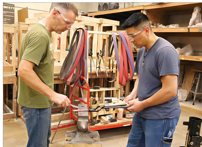
3. 创意力量：社区网络（Creative Forces: Community Network），照片拍摄：杰里米·托德/美国国家艺术基金会（Jeremy Todd/NEA）图片来自美国国家艺术基金会官网“创意力量：美国国家艺术基金会军事治疗艺术网络”项目，网址： https://www.arts.gov/initiatives/creative-forces/creative-forces-community-network