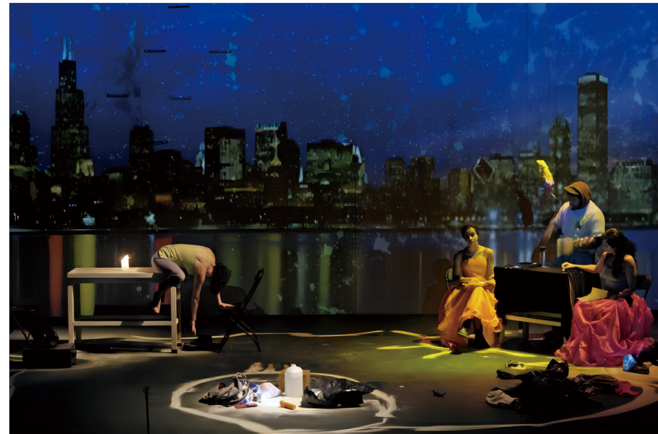
5. 当代多媒体表演《阿马里洛》，这是“南方曝光：拉丁美洲表演艺术”项目的一部分，图片摄影：埃里克·布德特（Eric Boudet），图片来自2012年美国国家艺术基金会年度报告，网址： https://www.arts.gov/about/publications/2012-annual-report

资金上的支持固然是公共部门面向社区艺术最重要的资助方式，但导入社会资源，为项目的有效开展提供路径同样重要。社区往往受限于高质量艺术资源的获取，项目规划与执行也难以得到可靠的研究支持，因此