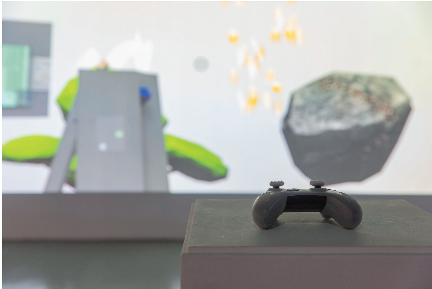
1. aaajiao (徐文恺), 《深渊模拟器》, 游戏, 2020, “未知游戏”展览现场