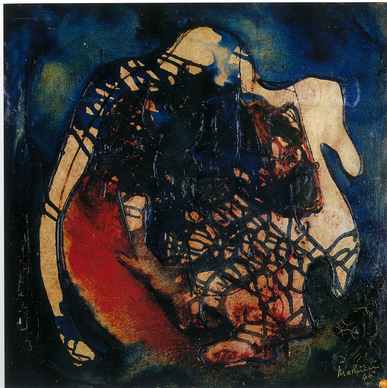
瓦解 油画 乔治·马修