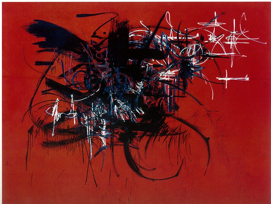
1.致敬 油画 乔治·马修 2.虹 油画 乔治·马修 3.特吕达尼德 油画 乔治·马修