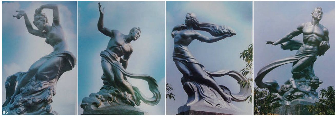
与历史同行：四川美术学院建校八十周年展（1940—2020） 第二单元 与历史同行：1978—2020 年 专题展