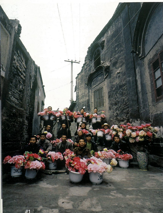
#1 怪不怪”的奇观。(高名潞语)

有人说当代新媒体艺术已成为一种哲学——因为它讲述观念。其实，当代新媒体艺术离哲学没有那么近，而离传统艺术也没有大多数人以为那么远。如果要鲁莽地谈论，我们可以说，哲学是在叙述“观念”是什么，而新媒体艺术刚好是要在这个“观念”所是之处打破其日常所是。新媒体艺术的崛起，不过是对消费社会大众语言的复兴所作出的回应。在所有产品都因工业设计而具有了某种“美”的形式或“艺术”的形式之后，在传统艺术语言已经以工业设计的名义进入日常生活之际，我们到哪里可能找到一种当代样式的纯粹艺术？这种艺术样式所使用的“语言”自然应该是“当代的”，因为它要承担的精神和情绪是当代所特有的那些精神和情绪（在这个意义上，我们不得不说架上画和传统雕塑所讲述的精神和情绪已是一种‘古典’的或‘玩味古典’的精神和情绪）。在我们这样子来注释过新媒体艺术作为当代艺术何以就是当代形态的艺术之后，回顾二十年来发生在成都这个城市的当代艺术事件及其人物，其意义也许就会更为显豁。这里是一群“外省”艺术家，他们不太可能像“巴黎”的艺术家那样在第二天醒来后就成为“著名艺术家”。这已注定只有不同寻常的虔诚和坚持才可能将事情进行到底，这也注定了这群要坚持下去的艺术家必得有置身名义场外的定力和胸襟，注定艺术在这儿只能被