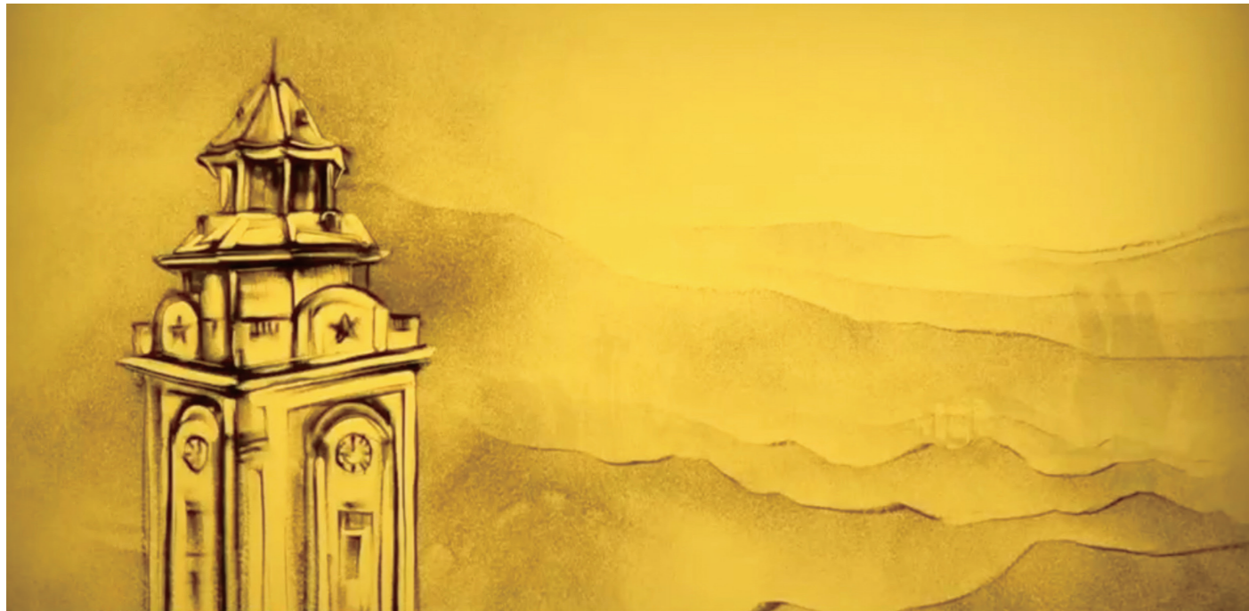
1. 沙画艺术作品《跨越时空的回信》